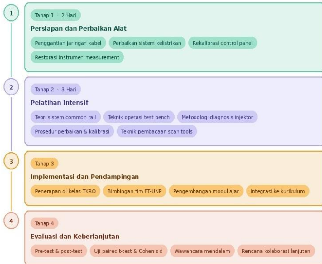
Gambar 1 Tahapan Pelaksanaan Program

menilai ketercapaian tujuan program dengan indikator yang terukur dan dapat diverifikasi. Integrasi data kuantitatif dan kualitatif memungkinkan tim pengabdian untuk mengukur tidak hanya peningkatan pengetahuan dan keterampilan teknis peserta, tetapi juga perubahan sikap dan motivasi mereka dalam mengadopsi teknologi baru.