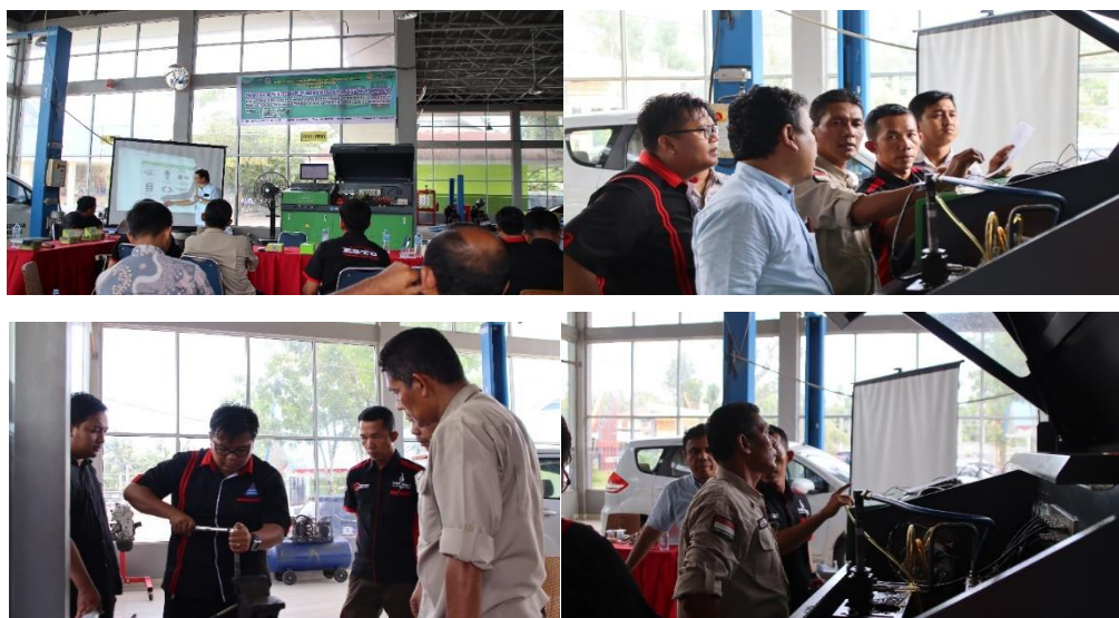
Gambar 3 Pelaksanaan Pelatihan Intensif

Pelatihan intensif dilaksanakan selama tiga hari mencakup teori dasar sistem bahan bakar injeksi diesel common rail , teknik pengoperasian test bench common rail , metodologi diagnosis kerusakan injektor, prosedur perbaikan injektor, dan teknik kalibrasi injektor. Pelaksanaan pelatihan ditunjukkan pada Gambar 3.