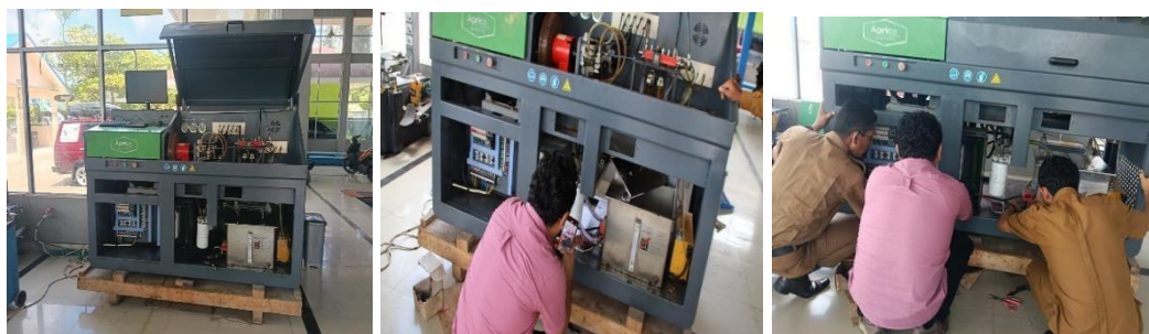
Gambar 2 Hasil Persiapan dan Perbaikan Alat

Tahap persiapan dan perbaikan alat dilaksanakan selama dua hari penuh mencakup penggantian dan penataan ulang jaringan kabel, perbaikan sistem kelistrikan, recalibrasi control panel , serta restorasi sistem instrumen measurement hingga seluruh komponen dapat berfungsi secara optimal. Hasil perbaikan secara visual ditunjukkan pada Gambar 2.