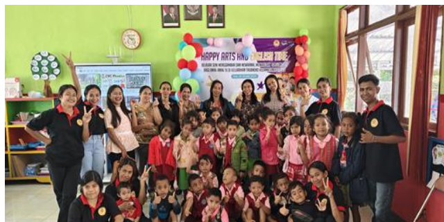
Gambar 3 Kegiatan Happy Arts and English Time

Secara keseluruhan, kegiatan pengabdian Happy Arts and English Time tidak hanya memberikan dampak positif terhadap peserta didik, tetapi juga terhadap guru sebagai TK Kristen Bethania Soe dalam meningkatkan inovasi pembelajaran. Kegiatan ini menjadi model integrasi seni dan bahasa berbasis play-based learning yang layak direplikasi pada jenjang PAUD dan TK lainnya, khususnya di daerah yang memiliki keterbatasan akses terhadap media pembelajaran berbasis seni dan bahasa agar tercipta suasana belajar seni dan bahasa yang menyenangkan.