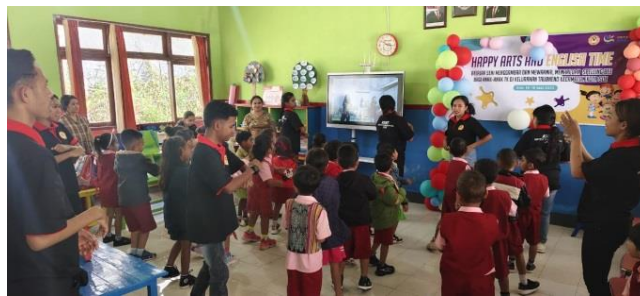
Gambar 2 Pelaksanaan Kegiatan Spelling Bee

Sementara itu, pelaksanaan Spelling Bee sederhana mendorong anak untuk berani berkomunikasi dalam bahasa Inggris. Meski tidak semua anak mampu menyebutkan atau mengeja kata dengan tepat, proses belajar yang disertai gerakan, lagu, dan gambar membuat mereka lebih cepat memahami dan mengingat kata-kata tersebut. Ini sesuai dengan teori pembelajaran multisensori yang menyatakan bahwa anak usia dini lebih mudah menyerap informasi melalui pengalaman langsung dan stimulasi berbagai indera (Marshal Sundawa & Martadi, 2021; Nurul Kusuma Dewi, 2018; Setiawan et al., 2022).