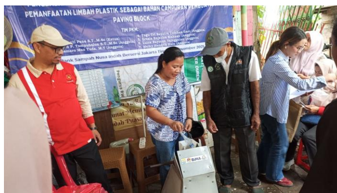
Gambar 5 Pengenalan dan Pelatihan Penggunaan Alat Pencacah Plastik

Setelah sosialisasi tahap 1 dan tahap 2 selesai, kegiatan dilanjutkan dengan pengenalan serta pelatihan penggunaan mesin pencacah plastik. Gambar 5 memperlihatkan proses pelatihan alat dan cara mengoperasikannya untuk mencacah plastik jenis PET.