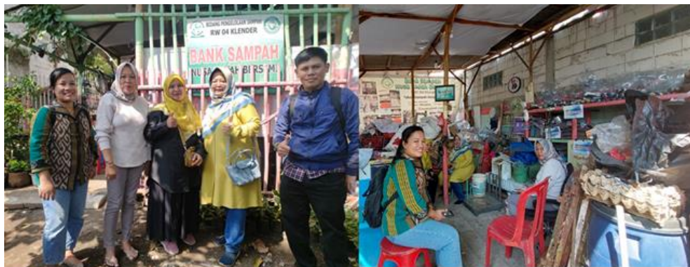
Gambar 1 Survei Tim ke Tempat Bank Sampah Nusa Indah Bersemi dan Diskusi Akan Pengolahan/ Daur Ulang Sampah Plastik

Pelaksanaan kegiatan Pengabdian kepada Masyarakat (PkM) dilakukan di Bank Sampah Nusa Indah Bersemi yang berlokasi di RW 04, Kelurahan Pondok Bambu, Klender, Jakarta Timur. Peserta kegiatan PkM terdiri dari 4 orang pengurus Bank Sampah Nusa Indah Bersemi, 15 masyarakat anggota Bank Sampah Nusa Indah Bersemi, serta Tim PkM. Sebelum dilakukan kegiatan PkM maka terlebih dahulu diadakan survei lapangan yang tujuannya untuk memastikan kondisi dari lapangan kegiatan. Gambar 1 menunjukkan survei dan diskusi awal yang dilakukan Tim PkM dengan pengurus Bank Sampah Nusa Indah Bersemi.