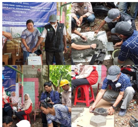
Gambar 6 Proses Pencacahan Plastik, Pencampuran Material, dan Pelatihan Pencetakan Paving Block dengan Material Campuran Plastik

Selanjutnya, dilakukan praktik langsung pembuatan paving block , di mana warga dilatih untuk: (1) membuat dan mencampur agregat halus, semen, dan air untuk tiga paving block normal berbentuk balok; (2) membuat tiga paving block balok dengan campuran pasir, semen, air, dan substitusi 10% pasir menggunakan plastik PET dari botol bekas (Ananda, 2022); serta (3) membuat tiga paving block berbentuk heksagonal dengan substitusi pasir sebesar 10% plastik PET (Indrawijaya, 2019). Hasil produk menunjukkan kualitas fisik yang cukup baik untuk penggunaan ringan hingga sedang, seperti penutup halaman atau jalur pejalan kaki. Keunggulan paving block ini adalah bobotnya yang lebih ringan, memanfaatkan limbah plastik sehingga lebih ramah lingkungan, serta memiliki daya serap air yang tidak terlalu tinggi (Kahfi et al., 2025). Proses pelatihan pembuatan paving block bersama warga dan tim PKM ditampilkan pada Gambar 6.