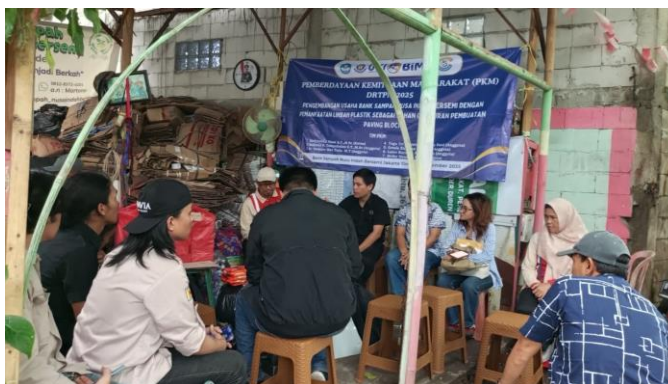
Gambar 3 Sosialisasi Tahap 1 Konsep 3R Dalam Penanganan Sampah Plastik

Rangkaian kegiatan PKM dimulai dari sosialisasi, pelatihan penggunaan alat mesin pencacah plastik, hingga pelatihan pembuatan paving block dengan campuran plastik dan tanpa campuran plastik. Para pengurus Bank Sampah Nusa Indah Bersemi turut hadir dalam kegiatan ini. Sosialisasi tahap pertama membahas mengenai jenis-jenis sampah, peningkatan volume sampah di Indonesia, dampak lingkungan yang ditimbulkan, serta penerapan konsep 3R ( Reduce, Reuse, dan Recycle ) dalam pengelolaan sampah plastik (Trisnawati & Khasanah, 2020). Gambar 3 memperlihatkan pelaksanaan kegiatan sosialisasi tahap pertama.