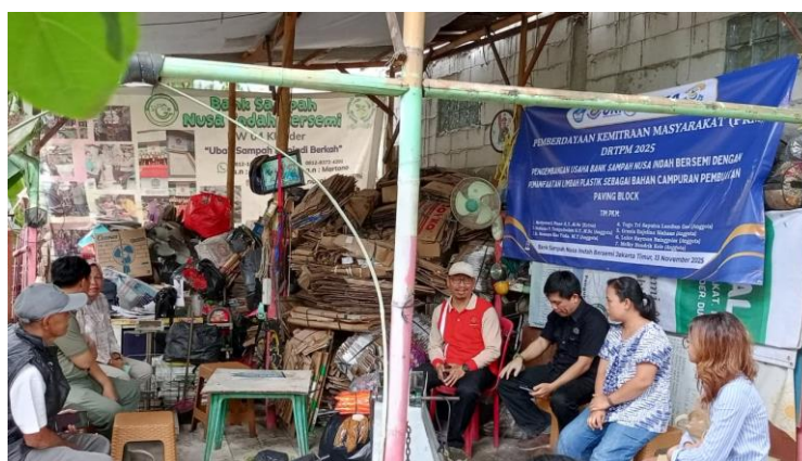
Gambar 4 Kegiatan Sosialisasi Tahap Kedua Mengenai Daur Ulang Limbah Plastik Sebagai Material Campuran Pembuatan Paving Block

berorientasi pada konsep ekonomi sirkular. Pada sosialisasi tahap kedua, para pengurus diperkenalkan pada cara memanfaatkan sampah plastik, terutama plastik PET dari botol bekas, sebagai bahan tambahan dalam pembuatan paving block (Kader et al., 2021). Tahap ini menjadi penghubung penting menuju proses pelatihan teknis, karena para pengurus mulai memahami secara langsung bagaimana limbah botol plastik dapat diolah menjadi produk yang memiliki manfaat serta nilai ekonomi. Kegiatan pada tahap kedua ini ditampilkan pada Gambar 4.