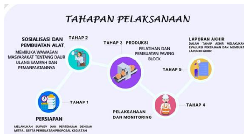
Gambar 2 Diagram Alir Tahap Pelaksanaan Pengabdian Kepada Masyarakat

Gambar 2 adalah diagram alir kegiatan PkM yang dimulai dari persiapan, pelaksanaan sampai dengan pelaporan serta monitoring evaluasi. Adapun tahapan kegiatan tersebut diantaranya: