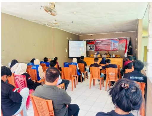
Gambar 3 Pelaksanaan sosialisasi