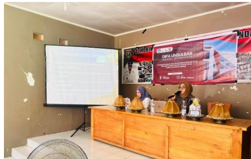
Gambar 2 Penyampaian materi