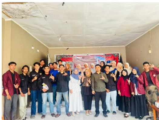
Gambar 4 Dokumentasi setelah kegiatan

Pemahaman peserta tentang etika berbahasa meningkat secara konsisten. Rekapitulasi disajikan pada Gambar 5 berikut ini: