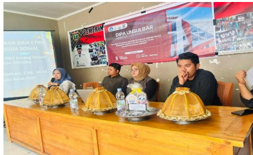
Gambar 1 Penyampaian persepsi awal kegiatan

metode penyampaian (3,39). Hasil ini sejalan dengan temuan (Ningsih, 2022) yang menyatakan bahwa penyampaian materi berbasis studi kasus dan metode interaktif meningkatkan minat belajar peserta bidang literasi digital. Modul pelatihan yang meliputi literasi UU ITE, etika berbahasa, serta gaya bahasa (ironi, sarkasme, metafora, dan lain-lain) terbukti relevan dengan kebutuhan generasi muda pengguna media sosial. Gambar berikut merupakan dokumentasi kegiatan pengabdian kepada masyarakat yang menggambarkan proses pelaksanaan sosialisasi dan pelatihan.