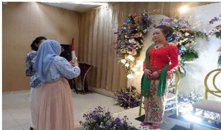
Gambar 3 Peserta Melaksanakan Praktik Foto

Gambar 3 menunjukkan praktik pengambilan foto menggunakan ponsel dengan backdrop, model, dan peralatan pendukung pengambilan foto yang disediakan. Tiga model yang digunakan sebagai objek foto, yaitu Mojang Sunda, Pengantin Sunda Siger, dan Pengantin RA Lasminingrat Kebesaran. Peserta juga berpartisipasi dalam menyediakan model sekaligus memaparkan filosofi yang terkandung dalam setiap busana pengantin yang ditampilkan.