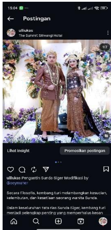
Gambar 4 Publikasi Peserta Pada Media Sosial Pribadi

Dalam tahapan ini, pendekatan participatory photography ditunjukkan dengan banyaknya konten pendidikan yang menjelaskan filosofi pengantin tradisional (Brigham & Kharbach, 2020; Strand et al., 2022; Turner et al., 2023) dan menambahkan narasi berbasis pengalaman nyata (Demir, 2024; Petrovski et al., 2024). Para peserta bukan hanya berbagi materi secara langsung mengenai filosofi pengantin tradisional di ruang pelatihan, akan tetapi mampu berbagi pengetahuan di ruang digital. Para peserta pun mampu menanggapi komentar yang diberikan oleh para pengikutnya dan menciptakan dialog kritis yang membangun kesadaran kolektif tentang pentingnya filosofi pengantin tradisional.