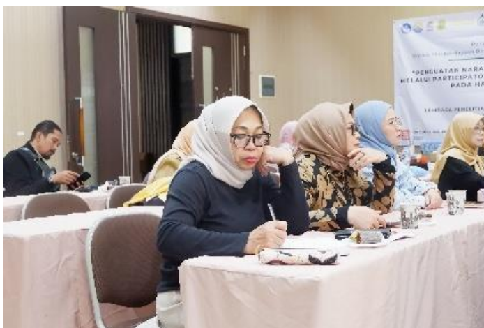
Gambar 2 Peserta Menuliskan Analisis SWOT HARPI Melati DPD Jawa Barat

Kegiatan sosialisasi dilakukan pada tanggal 27 Oktober 2025 di Bandung dengan 25 orang peserta yang merupakan pengurus HARPI Melati DPD Jawa Barat. Pada tahap ini, peserta melakukan analisis SWOT untuk mengidentifikasi kekuatan, kelemahan, peluang, dan tantangan HARPI Melati DPD Jawa Barat dalam menjaga dan mengembangkan nilai pengantin tradisional yang ditunjukkan pada Gambar 2.