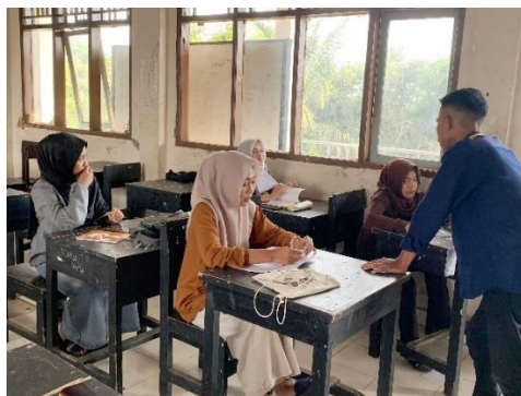
Gambar 1 Pelatihan Kursus Bahasa Inggris

mampu memberikan solusi praktis dalam memfasilitasi kebutuhan pendidikan dasar warga desa setempat.