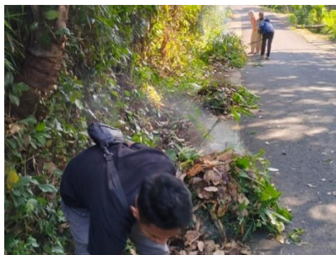
Gambar 6 Kegiatan Bersih-Bersih di Area Wisata