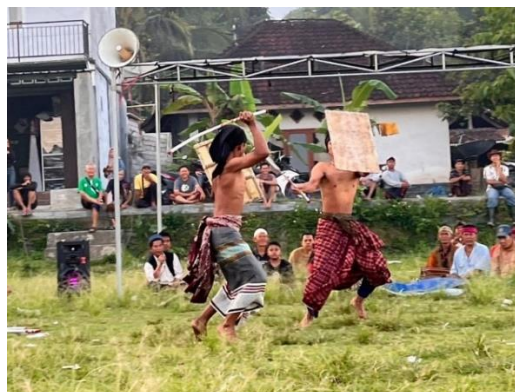
Gambar 5 Adu Tanding Dalam Acara Perisean