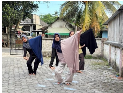
Gambar 4 Pelatihan Tari Tradisional Pulau Lombok

dasar dan sejarah asal usul tari agar peserta memahami secara utuh makna dari gerakan tersebut (Oktariani, 2024; Suparmi, 2023). Pembekalan wawasan historis sebelum praktik ini sangat esensial agar peserta tidak sekadar menghafal koreografi, melainkan turut meresapi nilai filosofis dari tarian yang dibawakan. Selain pelatihan, mahasiswa juga berpartisipasi langsung dalam tradisi gawe (pesta) desa tahunan sebagai salah satu upaya konkret untuk melestarikan budaya tradisional masyarakat setempat (Amalia & Agustin, 2022; Sari et al., 2022). Partisipasi aktif dalam ruang perayaan adat tersebut terbukti efektif sebagai instrumen kolaboratif untuk terus merawat dan menghidupkan eksistensi warisan budaya lokal. Rangkaian acara pelestarian budaya ini turut menampilkan kesenian Perisean , yaitu adu kekuatan ketangkasan dua pemuda menggunakan rotan dan perisai yang hampir serupa dengan pencak silat, sebagaimana diperlihatkan pada adu tanding di Gambar 5.