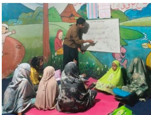
Gambar 2 Pelatihan Baca Tulis Bahasa Arab