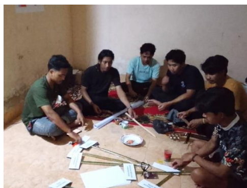
Gambar 7 Pembuatan Petunjuk Arah Area Wisata

Untuk memperkuat analisis kualitatif dampak program pariwisata, evaluasi dilakukan melalui observasi lapangan dan wawancara mendalam guna memetakan perubahan kebersihan lingkungan, fungsionalitas fasilitas pendukung, serta kemandirian warga dalam mengelola potensi desa. Pendekatan ini sejalan dengan pendapat Hajril et al. (2024) bahwa pendampingan intensif mampu memberikan solusi konkret atas permasalahan di lapangan sekaligus meningkatkan kesadaran ekonomi lokal masyarakat. Seluruh rincian temuan yang menggambarkan efektivitas intervensi tersebut dirangkum secara terperinci dalam Tabel 2 berikut ini.