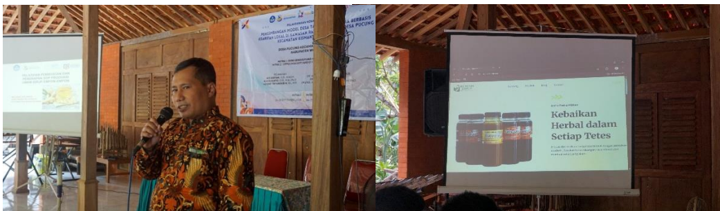
Gambar 5 Pelatihan Pembuatan Dan Penerapan SOP Serta Sistem Informasi Penjualan

Selanjutnya, pada bagian workshop sistem informasi penjualan, peserta diperkenalkan pada aplikasi digital sederhana untuk pencatatan transaksi dan pengelolaan stok. Pendekatan ini memudahkan anggota UPPKA dalam memonitor jumlah persediaan dan waktu yang tepat untuk melakukan promosi atau produksi ulang. Implementasi digitalisasi penjualan terbukti meningkatkan efisiensi, transparansi, dan akurasi data transaksi harian (Safitri, 2025; Siti Mahmudah & Novitasari Romadhona, 2025).