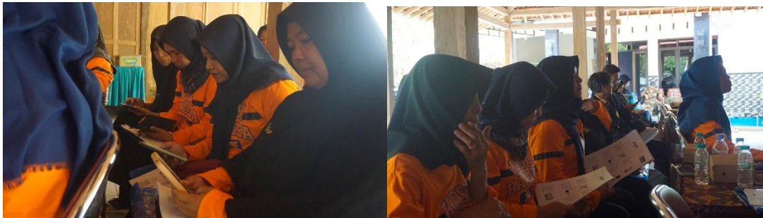
Gambar 6 Pelatihan Pembuatan Media Promosi Dan Pemasaran Online

lokal (Seputra & Pradnyawati, 2024). Pelatihan juga menumbuhkan kesadaran bahwa keberhasilan pemasaran tidak hanya bergantung pada kualitas produk, tetapi juga pada kemampuan membangun brand image dan komunikasi digital yang menarik.