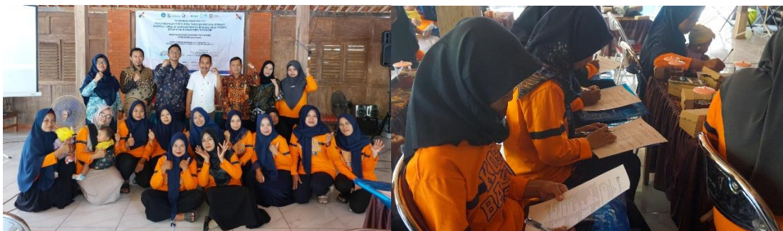
Gambar 2 Peserta Pelatihan Anggota UPPKA

Pelatihan hari pertama dibuka dengan sesi Good Manufacturing Practice (GMP) atau Cara Produksi Pangan yang Baik (CPPB) yang disampaikan oleh Dr.Eng. Ir. Pringgo Widyo Laksono, S.T., M.Eng, bisa dilihat pada Gambar 3. Materi ini menekankan pentingnya penerapan standar produksi yang higienis dan berkualitas agar produk herbal lokal, seperti sirup empon-empon, mampu bersaing di pasar nasional. Dr. Pringgo menjelaskan bahwa penerapan GMP menjadi kunci utama untuk memastikan bahwa setiap produk tidak hanya enak dikonsumsi, tetapi juga aman dan sesuai dengan ketentuan BPOM serta Standar Nasional Indonesia (SNI). Peserta diberikan pemahaman mendalam mengenai sanitasi tempat produksi, penataan ruang, pengendalian bahan baku, serta pengemasan dan pelabelan produk.