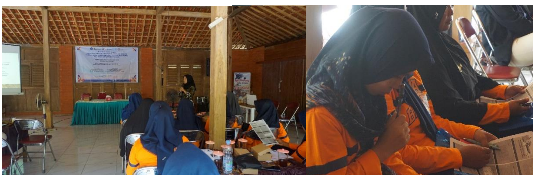
Gambar 4 Pelatihan Pembukuan Sederhana Dan Manajemen

Pelatihan juga jelaskan bahwa pembukuan yang baik memungkinkan pelaku usaha mengetahui posisi laba rugi secara akurat, menentukan harga jual yang wajar, serta merencanakan pengembangan usaha berbasis data finansial. Pembukuan sederhana memungkinkan pelaku usaha mengetahui kondisi laba-rugi, mengatur arus kas, serta menentukan harga jual secara rasional (Muttaqien et al., 2022). Pelatihan ini diikuti dengan simulasi pencatatan transaksi harian dan diskusi kelompok untuk memastikan setiap peserta memahami langkah-langkah yang benar dalam pengelolaan keuangan usaha kecil.