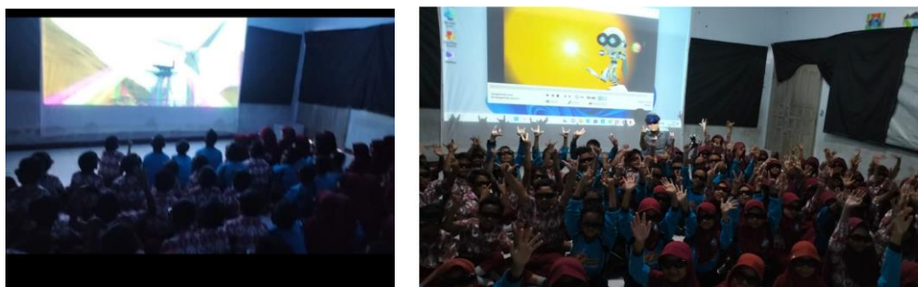
Gambar 4 Pemutaran Film Anti Bullying Kepada Siswa Sebagai Media Edukasi

Dengan demikian, film berfungsi sebagai media edukasi yang kuat yang tidak hanya memberikan pemahaman konseptual, tetapi juga memfasilitasi diskusi, refleksi karakter, dan penanaman nilai-nilai toleransi dan persaudaraan yang sejalan dengan pendidikan karakter di sekolah Muhammadiyah (Mujiwati et al., 2024).