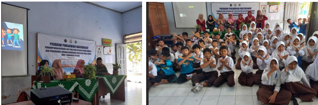
Gambar 2 Proses Sosialisasi Anti Bullying

memberikan peningkatan secara deskriptif, tetapi juga menunjukkan kekuatan intervensi yang tinggi ( high effect ) dalam konteks pendidikan dasar (Rahmanda, 2025). Apabila dianalisis lebih lanjut menggunakan uji statistik inferensial seperti paired sample t-test , maka peningkatan tersebut berpotensi menunjukkan hasil yang signifikan secara statistik ( p < 0,05 ) (Novita Sari Maria et al., 2025). Oleh karena itu, temuan ini menegaskan bahwa pendekatan sosialisasi yang dikombinasikan dengan media visual berupa film edukatif merupakan strategi yang efektif dalam meningkatkan pemahaman serta kesadaran siswa terhadap bullying dan upaya mitigasinya. (Setiowati & Astuti Dwiningrum, 2020).