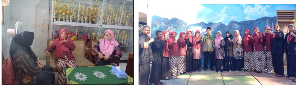
Gambar 3 Sosialisasi dengan Guru BK dan Pihak Sekolah dalam Rangka Mitigasi Bullying

Turut dalam kegiatan sosialisasi ini juga para guru BK dalam hal ini adalah wali kelas masing-masing. Mengingat di sekolah mitra belum memiliki guru BK tersendiri. Jadi tupoksi guru BK dirangkap oleh wali kelas.