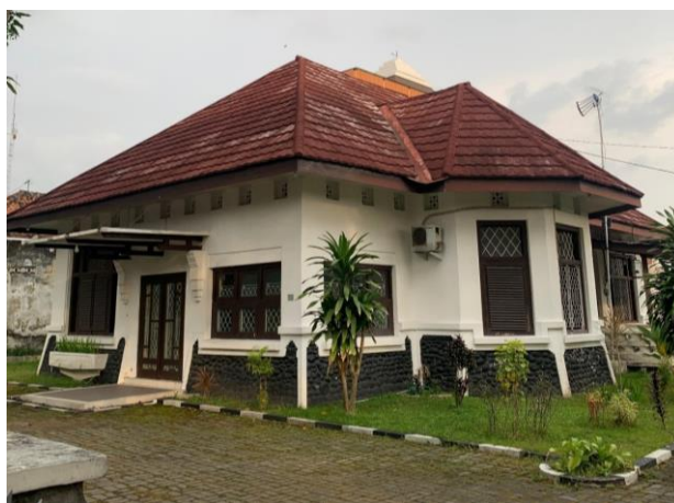
Gambar 3 Salah Satu Potensi Heritage di Kampung Bangirejo

Bangirejo. Sebagaimana dalam Gambar 3, kampung ini memiliki warisan arsitektur kolonial berupa rumah-rumah kuno. Keberadaannya tidak hanya memperkaya nilai estetika kawasan, tetapi juga bisa dikembangkan sebagai destinasi edukasi sejarah, homestay bernuansa heritage , atau ruang kreatif yang menarik wisatawan. Apalagi tren pariwisata saat ini menekankan pengalaman otentik dan pelestarian warisan budaya, sehingga Bangirejo dapat memperkuat citra sebagai kampung dengan nilai historis sekaligus ekonomi kreatif.