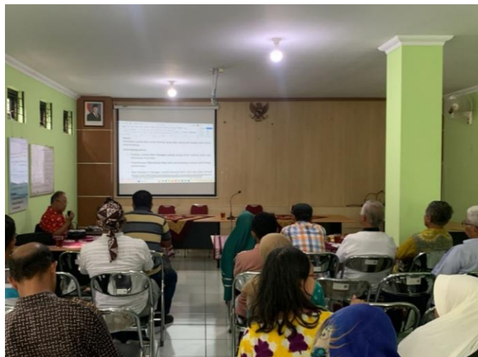
Gambar 5 Kegiatan FGD untuk Rekomendasi Rancangan RTJ

optimalisasi IPAL komunal, pengelolaan sampah terpadu, mitigasi risiko iklim dan banjir, dan penguatan kolaborasi antarpihak. Untuk penguatan kelembagaan dan modal sosial untuk ekonomi hijau dilakukan penguatan pokdarwis, gapoktan, komunitas seni, pengelola foodcourt , dan struktur RT/RW, penyusunan aturan kampung, serta pelatihan manajemen keuangan.