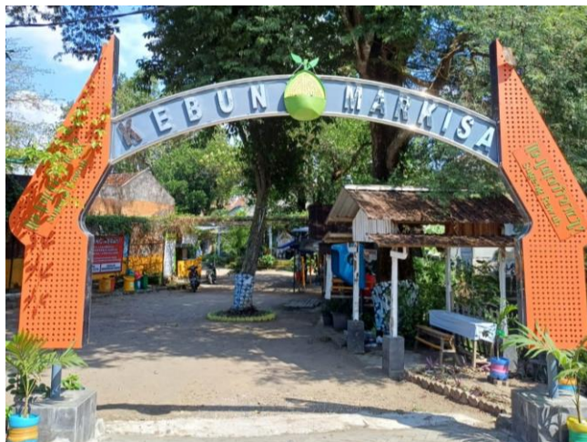
Gambar 2 Kebun Markisa di Kampung Blunyahrejo

Kampung Blunyahrejo saat ini menjadi pusat kegiatan ekonomi produktif berbasis pertanian perkotaan dan agrowisata. Melalui pengembangan Kebun Markisa seperti pada Gambar 2, kampung ini tidak hanya menghasilkan produk pertanian, tetapi juga menarik wisatawan untuk belajar sekaligus menikmati hasil olahan. Kehadiran agrowisata ini terbukti meningkatkan pendapatan masyarakat dan memperluas lapangan kerja. Selain itu, kegiatan seni seperti pentas menyanyi yang rutin digelar menjadi daya tarik budaya sekaligus sarana memperkuat interaksi sosial. Kehidupan ekonomi warga juga semakin dinamis dengan hadirnya UMKM lokal yang terorganisasi dalam foodcourt , menyediakan kuliner khas dan membuka peluang usaha baru. Kombinasi pertanian, wisata seni (setiap Senin, Rabu dan Sabtu malam), dan UMKM menjadikan Blunyahrejo keluar dari jerat kemiskinan serta tumbuh sebagai kampung mandiri dan berkelanjutan.