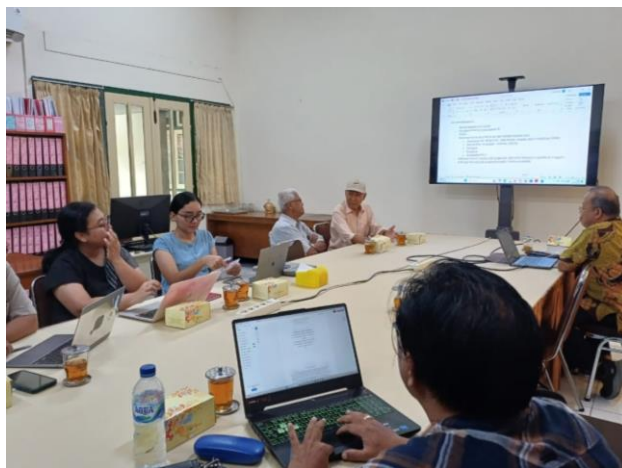
Gambar 4 Kegiatan FGD untuk Pemantapan Data

menghadirkan makna, keindahan, dan harmoni dalam hidup warganya melalui rebranding . Branding kampung memerlukan integrasi potensi alam, budaya, dan kreativitas warga (Kompas.com, 2022). Rebranding bukan sekedar mengganti nama atau logo, tetapi mengarahkan seluruh aktivitas pada identitas baru.