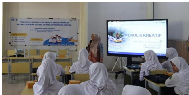
Gambar 2 Penyajian Materi oleh Narasumber

dan peribahasa. Penyampaian materi dilakukan dengan pendekatan interaktif agar peserta aktif bertanya dan berdiskusi seperti tampak pada Gambar 2 berikut.