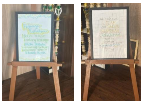
Gambar 7 Karya Peserta dipajang di Area Sekolah

Sebagai tindak lanjut, tim PkM tetap berkoordinasi dengan guru bidang studi Bahasa Indonesia dan Seni Budaya. Para guru memberikan pembelajaran serupa di kelasnya dengan menyesuaikan metode penulisan kreatif dengan materi pembelajaran Bahasa Indonesia atau Seni Budaya. Dengan menggabungkan unsur-unsur estetika Seni Budaya dengan aspek kreatif dan ekspresif Bahasa Indonesia, para pendidik dapat menciptakan kurikulum yang dinamis dan menarik yang tidak hanya meningkatkan keterampilan menulis tetapi juga memperdalam apresiasi siswa terhadap keindahan bahasa dan budaya. Pendekatan terpadu ini membutuhkan kolaborasi antara pendidik, siswa, dan masyarakat untuk mengatasi tantangan seperti keterbatasan sumber daya dan kesiapan guru, memastikan lingkungan belajar yang mendukung yang mempromosikan praktik pendidikan holistik dan transformatif (Apriyanto et al., 2025; Saud et al., 2024; Simanungkalit, 2024). Salah satu tulisan hasil karya peserta yang dipajang di area sekolah dapat dilihat pada Gambar 7 berikut.