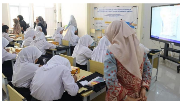
Gambar 3 Praktik Menulis Kreatif Siswa

Setelah penyampaian materi dan tanya jawab selesai, kegiatan dilanjutkan dengan sesi praktik. Guru-guru dibagi ke dalam tiga kelompok kecil, sedangkan para siswa secara individu membuat karya mereka langsung pada sampul buku yang telah dibagikan. Tim PkM memastikan semua siswa dan guru telah mendapatkan peralatan yang dibutuhkan untuk membuat karya tulis kreatif dan memberikan bimbingan langsung kepada seluruh peserta. Dalam sesi ini, peserta secara mandiri menghasilkan karya tulis kreatif mereka sendiri seperti tampak pada Gambar 3 berikut.