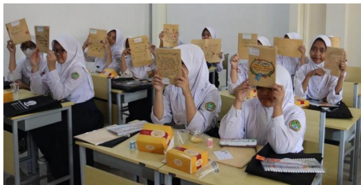
Gambar 4 Siswa dan Karyanya

Karya-karya tersebut merupakan tulisan tangan yang langsung dibuat oleh seluruh peserta pada hari itu. Karya siswa langsung digunakan sebagai sampul buku masing-masing, sedangkan karya guru dipajang di area pajang sekolah, sehingga dapat dibaca oleh seluruh warga sekolah. Guru dan siswa juga diberi alat tulis dan bahan lebih agar bisa membuat karya lainnya secara mandiri di luar kegiatan PkM ini.