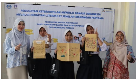
Gambar 5 Tim PKM dan Siswa di Akhir Acara

Tahap evaluasi kegiatan juga dilakukan melalui sesi refleksi bersama antara tim PKM, guru, dan siswa. Dalam sesi ini, peserta menyampaikan kesan, pengalaman, serta masukan terhadap kegiatan yang sudah dilakukan. Hasil refleksi menunjukkan bahwa kegiatan literasi ini dinilai sangat bermanfaat karena memberikan pengalaman baru dalam menulis kreatif dan menumbuhkan rasa bangga terhadap karya sendiri. Foto tim PKM bersama siswa dengan memegang hasil karya mereka dapat dilihat pada Gambar 5 berikut.