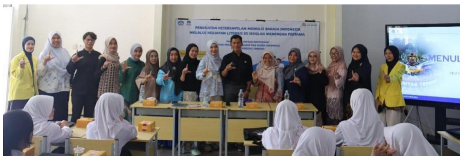
Gambar 6 Foto Bersama Tim PKM dan Peserta Guru

Sebagai tindak lanjut, tim PkM tetap berkoordinasi dengan guru bidang studi Bahasa Indonesia dan Seni Budaya. Para guru memberikan pembelajaran serupa di kelasnya dengan menyesuaikan metode penulisan kreatif dengan materi pembelajaran Bahasa Indonesia atau Seni Budaya. Dengan menggabungkan unsur-unsur estetika Seni Budaya dengan aspek kreatif dan ekspresif Bahasa Indonesia, para pendidik dapat menciptakan kurikulum yang dinamis dan menarik yang tidak hanya meningkatkan keterampilan menulis tetapi juga memperdalam apresiasi siswa terhadap keindahan bahasa dan budaya. Pendekatan terpadu ini membutuhkan kolaborasi antara pendidik, siswa, dan masyarakat untuk mengatasi tantangan seperti keterbatasan sumber daya dan kesiapan guru, memastikan lingkungan belajar yang mendukung yang mempromosikan praktik pendidikan holistik dan transformatif (Apriyanto et al., 2025; Saud et al., 2024; Simanungkalit, 2024). Salah satu tulisan hasil karya peserta yang dipajang di area sekolah dapat dilihat pada Gambar 7 berikut.