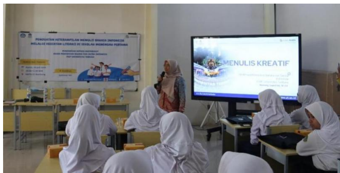
Gambar 2 Penyajian Materi oleh Narasumber

wakil kepala sekolah. Sebelum sesi penyampaian materi oleh narasumber, tim pengabdian yang dipandu oleh 2 orang mahasiswa Prodi Pendidikan Bahasa dan Sastra Indonesia memberikan ice breaking kepada seluruh peserta agar kegiatan menjadi lebih rileks. Semua peserta, baik guru dan siswa bersemangat mengikuti ice breaking tersebut. Selanjutnya, tim dosen menyampaikan materi pelatihan tentang teknik penulisan kreatif, mencakup penulisan kata motivasi, kata mutiara, pantun, dan peribahasa. Penyampaian materi dilakukan dengan pendekatan interaktif agar peserta aktif bertanya dan berdiskusi seperti tampak pada Gambar 2 berikut.