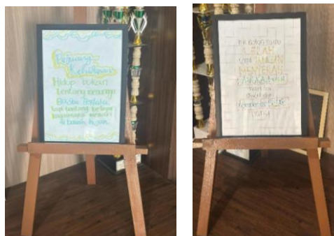
Gambar 7 Karya Peserta dipajang di Area Sekolah

Sebagai tindak lanjut, tim PkM tetap berkoordinasi dengan guru bidang studi Bahasa Indonesia dan Seni Budaya. Para guru memberikan pembelajaran serupa di kelasnya dengan menyesuaikan metode penulisan kreatif dengan materi pembelajaran Bahasa Indonesia atau Seni Budaya. Dengan menggabungkan unsur-unsur estetika Seni Budaya dengan aspek kreatif dan ekspresif Bahasa Indonesia, para pendidik dapat menciptakan kurikulum yang dinamis dan menarik yang tidak hanya meningkatkan keterampilan menulis tetapi juga memperdalam apresiasi siswa terhadap keindahan bahasa dan budaya. Pendekatan terpadu ini membutuhkan kolaborasi antara pendidik, siswa, dan masyarakat untuk mengatasi tantangan seperti keterbatasan sumber daya dan kesiapan guru, memastikan lingkungan belajar yang mendukung yang mempromosikan praktik pendidikan holistik dan transformatif (Apriyanto et al., 2025; Saud et al., 2024; Simanungkalit, 2024). Salah satu tulisan hasil karya peserta yang dipajang di area sekolah dapat dilihat pada Gambar 7 berikut.