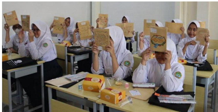
Gambar 4 Siswa dan Karyanya

Selain membuat karya, guru juga berperan sebagai fasilitator dan pendamping, sementara siswa berperan sebagai pencipta ide dan penulis utama. Berbagai karya kreatif berhasil dihasilkan, seperti kata motivasi, kata mutiara bertema, serta peribahasa yang relevan dengan kehidupan sehari-hari siswa. Tentu saja disertai dengan desain dan ilustrasi warna warni sesuai minat dan kreativitas mereka masing-masing, seperti terlihat pada Gambar 4 berikut.