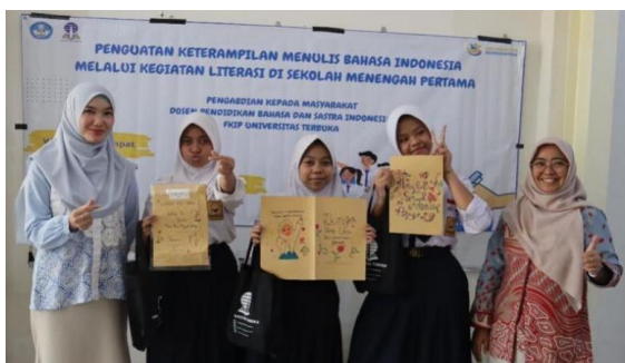
Gambar 5 Tim PKM dan Siswa di Akhir Acara

Tahap evaluasi kegiatan juga dilakukan melalui sesi refleksi bersama antara tim PKM, guru, dan siswa. Dalam sesi ini, peserta menyampaikan kesan, pengalaman, serta masukan terhadap kegiatan yang sudah dilakukan. Hasil refleksi menunjukkan bahwa kegiatan literasi ini dinilai sangat bermanfaat karena memberikan pengalaman baru dalam menulis kreatif dan menumbuhkan rasa bangga terhadap karya sendiri. Foto tim PKM bersama siswa dengan memegang hasil karya mereka dapat dilihat pada Gambar 5 berikut.