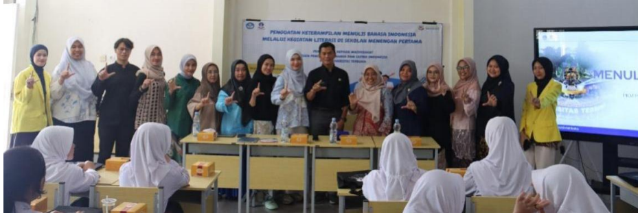
Gambar 6 Foto Bersama Tim PKM dan Peserta Guru

mengekspresikan ide melalui tulisan. Di akhir acara, para guru dan tim PKM dosen beserta mahasiswa berfoto bersama seperti tampak dalam Gambar 6 berikut.