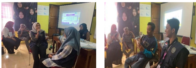
Gambar 8 Aktivitas Topik 6

Kegiatan aktivitas topik 6 yaitu prosedur layanan konseling sebaya dan alih tangan kasus ( referral ) dilaksanakan pada tanggal 30 Juni 2024 menggunakan metode praktik langsung dengan format individu dan kelompok. Berikut merupakan foto aktivitas topik 6.