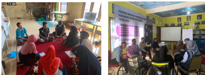
Gambar 9 Aktivitas Topik 7

Luaran dari kegiatan yang telah tercapai adalah sasaran mampu mengaplikasikan prosedur dan keterampilan konselor sebaya sesuai masalah yang diberikan tim pengabdian. Sasaran aktif dan semangat dalam melaksanakan sesi roleplay sebagai seorang konselor sebaya pada disabilitas fisik.