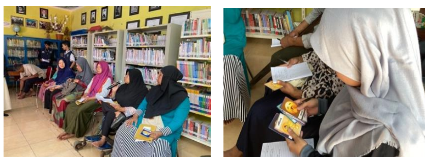
Gambar 4 Aktivitas Topik 2

Kegiatan aktivitas topik 2 yaitu kenali jenis dan pengelolaan emosi dilaksanakan pada tanggal 15 Juni 2024 menggunakan metode psikoedukasi, media flashcard emosi, dan trapesium usia. Berikut bukti dokumentasi aktivitas topik 2: