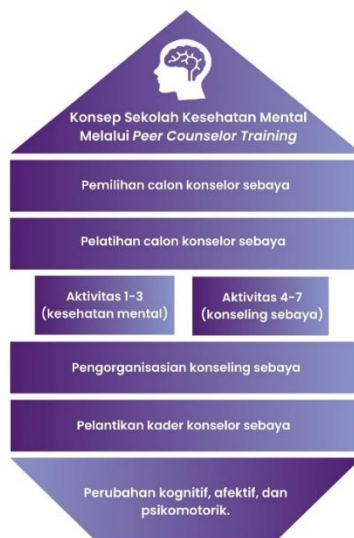
Gambar 2 Konsep Sekolah Kesehatan Mental Melalui Peer Counselor Training

terapeutik (Putra & Soetikno, 2018). Konsep sekolah kesehatan mental melalui peer counselor training ditunjukkan pada gambar berikut.