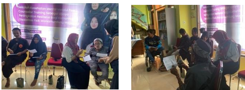
Gambar 7 Aktivitas Topik 5

Kegiatan aktivitas topik 5 yaitu keterampilan dasar konseling dilaksanakan tanggal 29 Juni 2024 dengan menggunakan metode praktik langsung yaitu modelling dan roleplay . Berikut merupakan gambar aktivitas topik 5.