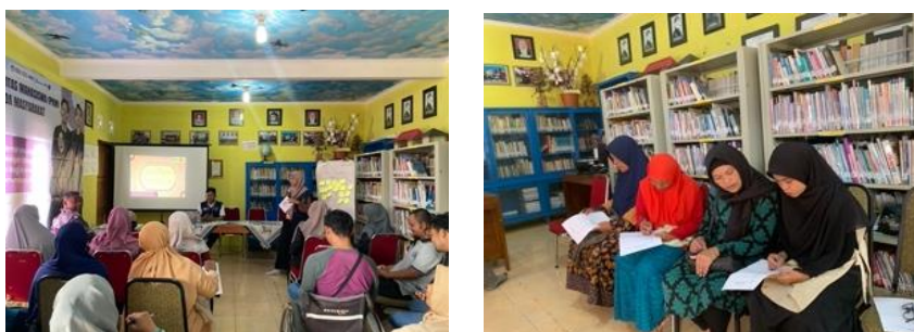
Gambar 6 Aktivitas Topik 4

Kegiatan aktivitas topik 4 yaitu pengenalan, prinsip, kode etik bagi konselor sebaya dalam konseling sebaya dilaksanakan pada tanggal 22 Juni 2024 menggunakan metode ceramah dan diskusi kelompok. Berikut merupakan dokumentasi aktivitas topik 4.