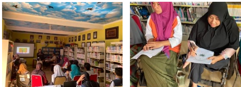
Gambar 3 Aktivitas Topik 1

dilaksanakan pada tanggal 8 Juni 2024 menggunakan metode psikoedukasi dan expressive writing . Berikut merupakan gambar aktivitas topik 1.