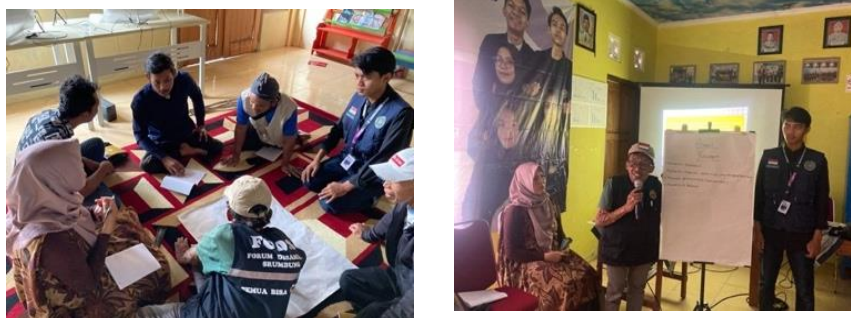
Gambar 5 Aktivitas Topik 3

Kegiatan aktivitas topik 3 yaitu keterampilan komunikasi dan membina hubungan interpersonal dilaksanakan pada tanggal 22 Juni 2024 menggunakan metode ceramah, focus group discussion serta presentasi. Berikut gambar pada aktivitas topik 3.