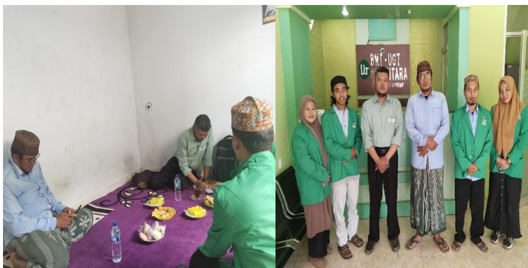
Gambar 1 Diskusi Penyusunan MRP Berbasis Microsoft Excel

MRP berbasis microsoft excel ini, diharapkan dapat membantu kinerja team leader pembiayaan, dan mempermudah komite pembiayaan dalam mengambil keputusan. Kegiatan tahap pertama yang dilakukan bersama mitra adalah melakukan diskusi dan penyamaan persepsi dalam menentukan format FAPS dan MRP berbasis microsoft excel sesuai dengan kaidah dan/atau pembiayaan berdasarkan dengan prinsip syariah (Gambar 1).