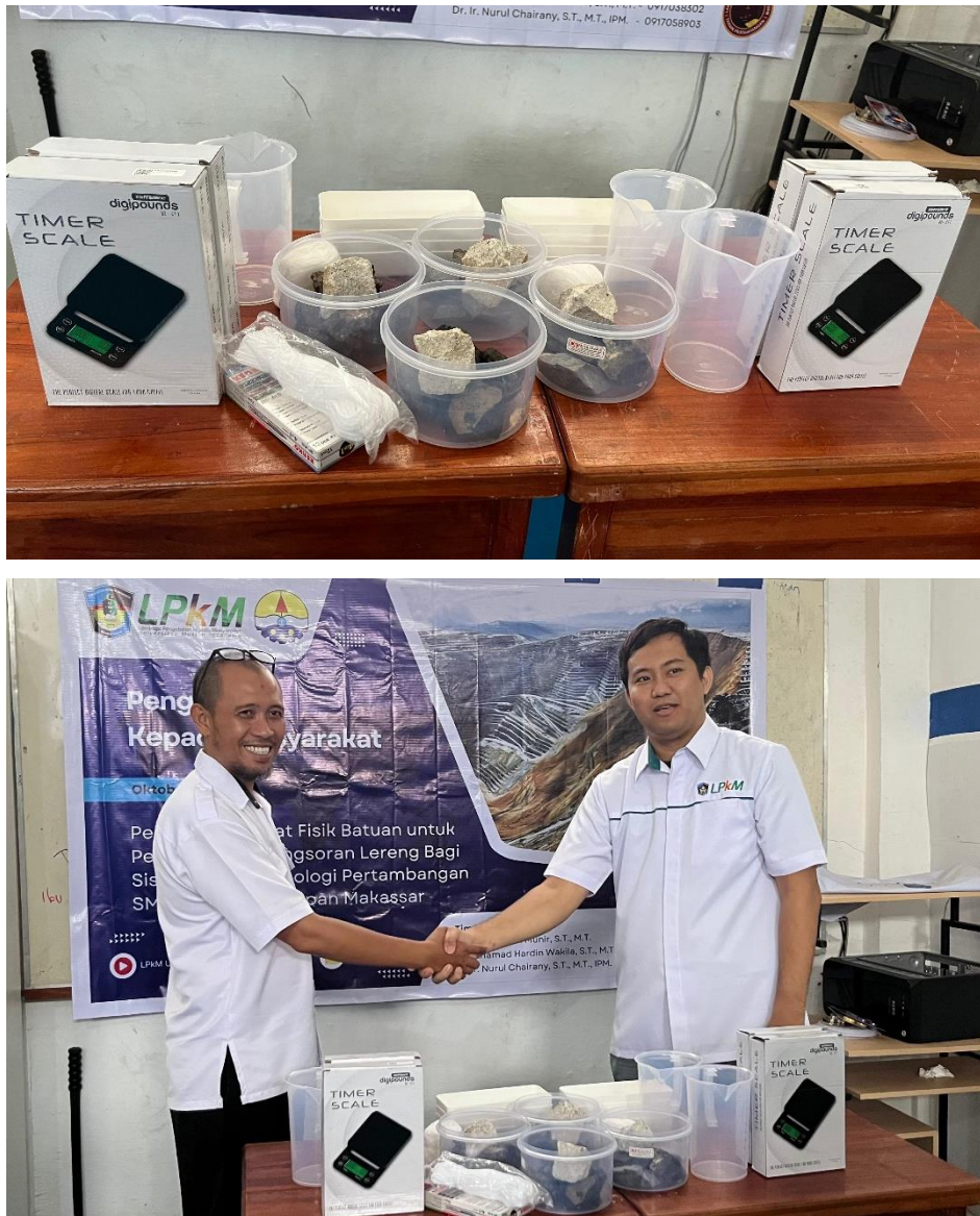
Gambar 3 Alat dan bahan praktikum dan prosesi penyerahannya

Setelah penyerahan aset ke sekolah, kegiatan pengabdian selanjutnya dilanjutkan dengan penyampaian materi berupa teori-teori mengenai gerakan massa tanah dan batuan. Penyampaian materi disampaikan melalui presentasi dan pemutaran video singkat dari Badan Nasional Penanggulangan Bencana (BNPB) Republik Indonesia yang berkaitan dengan bencana tanah longsor. Sebelum materi disampaikan, tim pengabdian terlebih dahulu menggali kemampuan peserta mengenai materi pelatihan, misalnya pengetahuan mereka mengenai gerakan massa tanah dan batuan. Semua peserta masih awam mengenai gerakan massa tanah dan batuan,