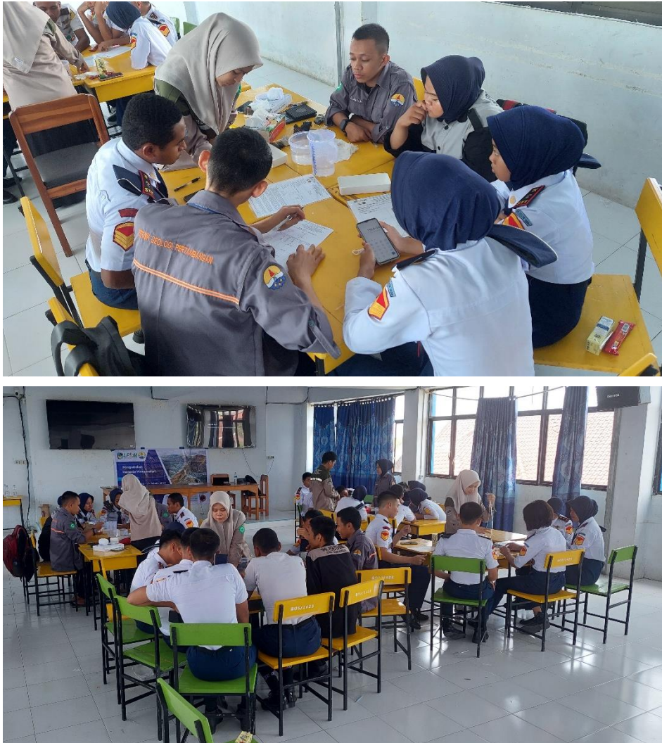
Gambar 6 Penjelasan materi dan langkah kerja pengujian sifat fisik batuan

Pengabdian masyarakat ini ditutup dengan mengulas kembali materi yang telah diberikan dan proses praktikum pengujian sifat fisik batuan yang telah diikuti oleh siswa Jurusan Geologi Pertambangan, SMK Penerbangan Techno Terapan Makassar. Setelah itu, dosen dan asisten melakukan evaluasi mengenai peningkatan pemahaman mereka mengenai bencana gerakan tanah dan batuan yang menunjukkan peningkatan pengetahuan dan pengalaman mengenai bencana ini. Pasca evaluasi terhadap pengetahuan dan keterampilan siswa didapatkan peningkatan dengan persentase 86,5% yang sebelumnya hanya 37%. Evaluasi ini dilakukan dengan membagi kuesioner dan melalui pertanyaan-pertanyaan secara langsung kepada peserta.