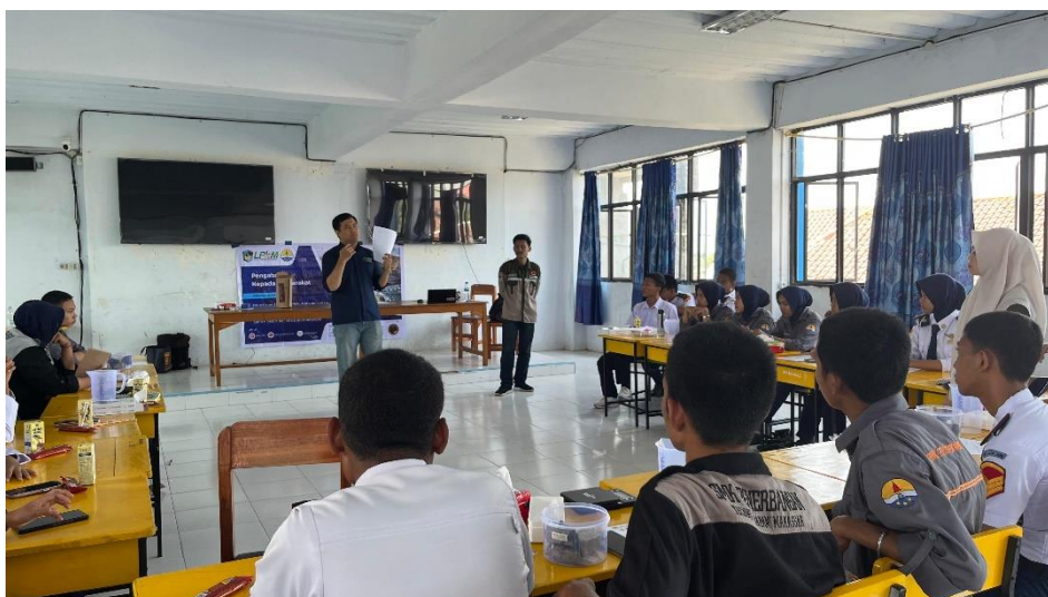
Gambar 5 Penjelasan materi dan langkah kerja pengujian sifat fisik batuan

Hari kedua pengabdian masyarakat dipindahkan ke ruangan yang lebih luas karena jumlah peserta bertambah menjadi 27 orang yang merupakan gabungan antara siswa kelas X dan kelas XII, Jurusan Geologi Pertambangan, SMK Penerbangan Techno Terapan, Makassar. Kegiatan pengabdian hari kedua diawali dengan penyampaian materi atau pengulangan materi yang telah disampaikan sebelumnya karena ada penambahan peserta yang tidak mengikuti materi pada hari sebelumnya. Setelah pengulangan materi, tim dosen kemudian menjelaskan materi dasar dan langkah kerja (SOP) dari pengujian sifat fisik batuan yang merupakan judul pada pengabdian ini. Gambar 5 merupakan penjelasan materi dan langkah kerja pengujian sifat fisik batuan.