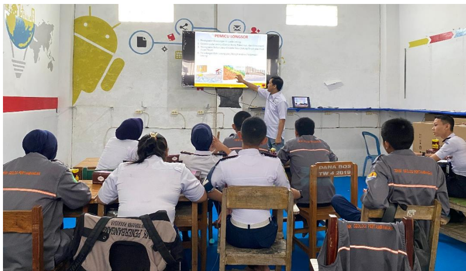
Gambar 4 Penyampaian materi kepada peserta pelatihan

Kegiatan pelatihan ini sangat disambut baik oleh sekolah karena sekolah merasa terbantu dengan kedatangan tim dosen pengabdian dari kampus sebagai salah satu wujud mengaplikasikan tridarma perguruan tinggi. Kedatangan tim pengabdian dapat membantu sekolah dalam pemberian materi yang berkaitan dengan ilmu geologi pertambangan karena salah satu kendala yang dihadapi oleh sekolah yakni sangat kurangnya tenaga pengajar (guru) lulusan program studi teknik geologi atau teknik pertambangan. Mayoritas lulusan program studi ini memilih bekerja di perusahaan sebagai seorang insinyur daripada menjadi guru di sekolah-sekolah. Gambar 4 menunjukkan proses penyampaian materi mengenai kelongsoran pada hari pertama yang diikuti oleh sembilan siswa kelas XII.