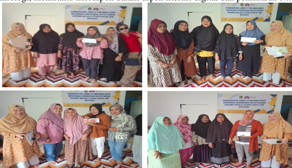
Gambar 4 Kelompok Pengaplikasian Materi

Setelah seluruh rangkaian pelatihan selesai, dilakukan tahapan evaluasi, monitoring, dan penguatan program. Tahap ini bertujuan untuk mengevaluasi efektivitas pelatihan, memantau penerapan keterampilan yang telah diajarkan, serta memberikan dukungan tambahan agar peserta dapat terus memanfaatkan keterampilan tersebut secara berkelanjutan dalam kehidupan mereka. Peserta pelatihan dikelompokkan menjadi 4 kelompok, dengan pendekatan kolaboratif yang menggabungkan peserta yang lebih muda dan lebih tua dalam setiap kelompok. Pendekatan ini bertujuan untuk memanfaatkan keahlian unik masing-masing peserta. Janda yang lebih tua, yang umumnya memiliki keterampilan teknis seperti membuat kue dan kerajinan tangan, berbagi keahlian mereka dalam produksi barang. Sementara itu, janda yang lebih muda, yang lebih cepat beradaptasi dengan teknologi, membantu kelompok dalam aspek literasi digital dan pemasaran online .