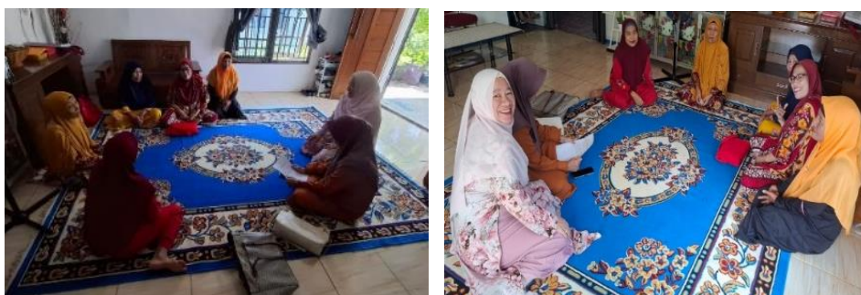
Gambar 1 Survei Awal

Meskipun koneksi internet di wilayah tersebut cukup memadai, keterbatasan ekonomi menjadi penghalang utama bagi para janda untuk memaksimalkan potensi teknologi yang mereka miliki. Banyak dari mereka menyatakan bahwa biaya untuk membeli kuota internet menjadi beban tambahan yang harus diprioritaskan di tengah kebutuhan sehari-hari lainnya, seperti makanan dan kebutuhan pokok. Kondisi ini membuat mereka kesulitan untuk secara rutin menggunakan internet, baik untuk belajar keterampilan baru maupun untuk mencari peluang usaha yang dapat meningkatkan pendapatan. Berikut ini adalah dokumentasi survei awal terlihat pada Gambar 1.