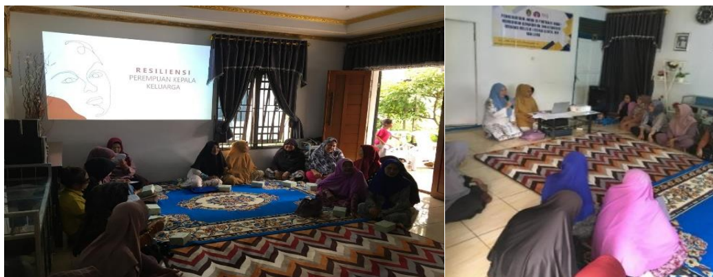
Gambar 2 Penyampaian Materi Resiliensi

Berdasarkan hasil pemetaan sebelumnya, ditemukan bahwa para janda di Pontianak Barat sering menghadapi tekanan berat sebagai kepala keluarga, baik dari sisi ekonomi maupun sosial. Banyak peserta mengungkapkan perasaan terisolasi dan mengalami kecemasan tinggi akibat stigma sosial, serta beban sebagai pencari nafkah tunggal. Oleh karena itu, pelatihan ini dirancang khusus untuk membantu mereka memperkuat ketahanan mental dan meningkatkan kemampuan coping dalam menghadapi berbagai tantangan hidup. Dokumentasi kegiatan pelatihan resiliensi dapat dilihat pada Gambar 2.