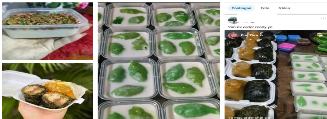
Gambar 5 Hasil Monitoring Penjualan Usaha

Dalam tahap evaluasi, ketua kelompok diundang untuk mewakili kelompok mereka. Proses evaluasi dilakukan melalui wawancara dan Focus Group Discussion (FGD) dengan para ketua kelompok untuk menggali umpan balik mengenai pengalaman pasca-pelatihan. Melalui sesi ini, para ketua kelompok memberikan laporan tentang tantangan yang dihadapi anggotanya, kemajuan yang dicapai, serta dukungan tambahan yang mereka butuhkan untuk memaksimalkan keterampilan yang telah dipelajari.