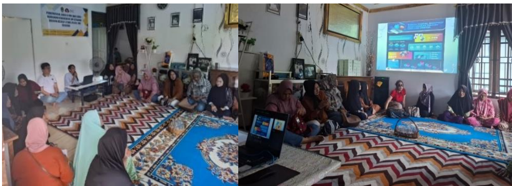
Gambar 3 Penyampaian Materi Literasi Digital

memanfaatkan Wi-Fi gratis yang disediakan selama pelatihan, sehingga mereka dapat lebih efisien dalam menggunakan internet. Peserta kemudian diajarkan cara memanfaatkan platform e-commerce seperti Shopee dan media sosial seperti Instagram dan Facebook untuk menjual produk mereka. Sesi ini mencakup panduan langkah demi langkah untuk membuat akun, mengunggah produk, menulis deskripsi yang menarik, serta strategi menentukan harga yang kompetitif. Berikut dokumentasi penyampaian materi literasi digital dapat dilihat pada Gambar 3.