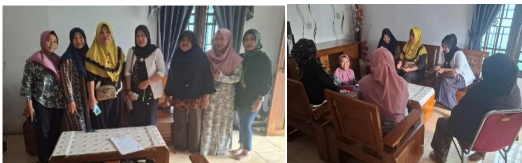
Gambar 6 Monitoring dan Evaluasi

Dengan pendekatan yang komprehensif dalam evaluasi dan penguatan ini, diharapkan program dapat memberikan dampak positif yang berkelanjutan bagi para peserta. Dukungan lebih lanjut akan terus diberikan melalui sesi konsultasi dan komunikasi jarak jauh untuk memastikan keberlanjutan usaha yang telah dirintis. Laporan akhir dari program ini akan disusun untuk memberikan rekomendasi yang lebih baik bagi pelaksanaan program serupa di masa mendatang, sehingga pelatihan dapat semakin efektif dalam memberdayakan komunitas yang membutuhkan.