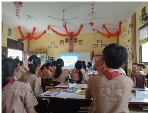
Gambar 3 Pengenalan dan Demonstrasi Penggunaan Assemblr Edu Berbantuan Kartu AR di HP

pembelajaran. Pemberian materi sosialisasi tentang penggunaan Assemblr Edu dapat dilihat pada Gambar 3 berikut.