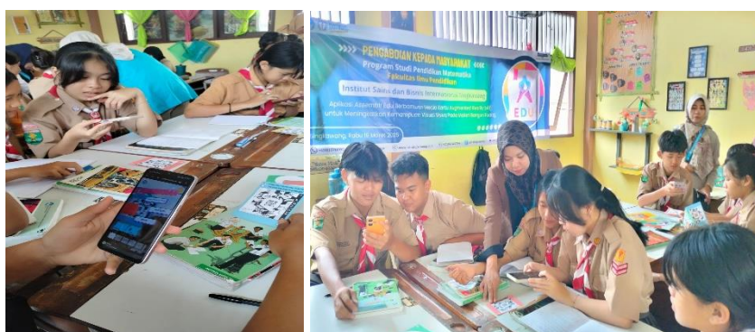
Gambar 4 Siswa Berdiskusi Dalam Tiap Kelompok Menyelesaikan Permasalahan Materi Bangun Ruang

Sesi kedua siswa berdiskusi dalam tiap kelompok untuk menyelesaikan permasalahan materi bangun ruang. Setiap kelompok disiapkan 4 kartu yang sudah ada QR code dan ada nama bangun ruang pada masing-masing kartu. Bersama kelompok siswa menyelesaikan setiap permasalahan yang ada pada kartu yaitu siswa memulai dengan mencatat materi sampai mengerjakan soal yang sudah disediakan sesuai dengan bangun ruang kubus, balok, prisma segitiga, dan tabung. Proses observasi saat siswa mengerjakan soal-soal evaluasi ditunjukkan pada Gambar 4 berikut.