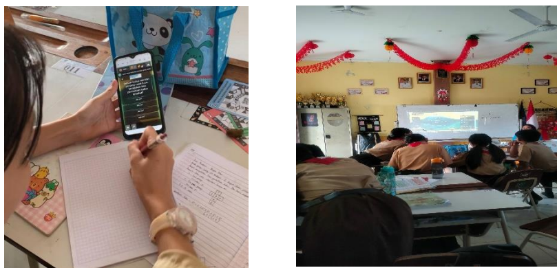
Gambar 5 Sesi Pengerjaan Kuis Menggunakan Quizizz

berbantuan kartu AR dalam memahami dan menjelaskan konsep bangun ruang, serta menyelesaikan permasalahan bangun ruang yaitu menghitung luas permukaan bangun ruang. Selanjutnya pemberian kuis interaktif menggunakan aplikasi Quizizz untuk melihat pemahaman siswa sebagai bahan evaluasi terhadap efektivitas pembelajaran yang telah diterapkan. Berikut dokumentasi sesi pengerjaan kuis siswa yang dilakukan secara berkelompok pada Gambar 5.