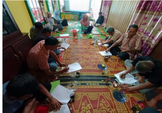
Gambar 1 Pengisian Kuesioner Pre-Test oleh anggota GAPOKTAN Sepakat dan Kelompok Tani JUT

Gambar 1 menunjukkan pengisian kuesioner ( pre-test ) yang diisi oleh anggota kelompok tani. Hasil pre-test menunjukkan bahwa sebanyak 76% peserta mengetahui secara umum tujuan laporan keuangan, namun hanya 29% peserta yang pernah melakukan pencatatan transaksi usaha tani secara teratur. Dari peserta yang tidak melakukan pencatatan, 60% menyatakan alasan utamanya adalah tidak tahu bagaimana cara membuat laporan keuangan yang benar. Sisanya menyebutkan alasan seperti tidak ada waktu untuk mencatat, menganggap pencatatan tidak penting, atau merasa pencatatan terlalu rumit. Hasil ini menunjukkan adanya gap antara pengetahuan tentang pentingnya laporan keuangan dan praktik aktual pencatatan di lapangan. Gap ini menjadi fokus intervensi dalam sesi pelatihan dan pendampingan.