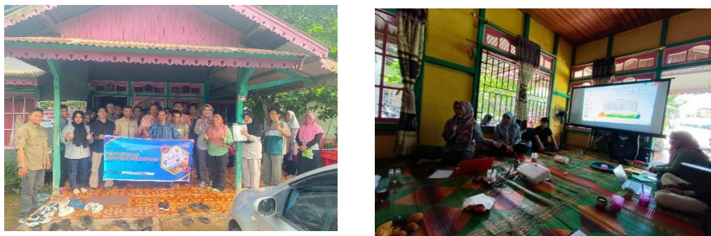
Gambar 4 Proses penyuluhan / pemberian materi Penyusunan laporan Keuangan pada GAPOKTAN

dengan latar belakang pendidikan yang rendah menyebabkan sebagian peserta kesulitan memahami istilah-istilah akuntansi meskipun telah disederhanakan; adanya keterbatasan teknologi yaitu tidak semua peserta memiliki akses ke perangkat komputer, sehingga pencatatan masih banyak dilakukan secara manual.