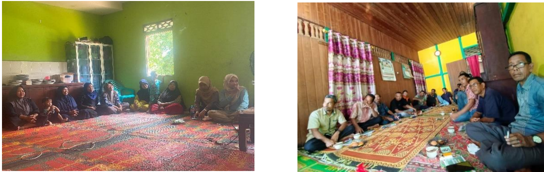
Gambar 2 Anggota GAPOKTAN memperhatikan penyampaian materi penyusunan laporan keuangan

Pada sesi simulasi, peserta diajak untuk mempraktikkan pencatatan transaksi harian berdasarkan studi kasus. Studi kasus disusun sedemikian rupa untuk merepresentasikan kondisi usaha tani padi, seperti pembelian pupuk, sewa traktor, biaya tenaga kerja panen, dan hasil penjualan gabah. Gambar 2 menunjukkan peserta mengikuti simulasi dan penyampaian materi.