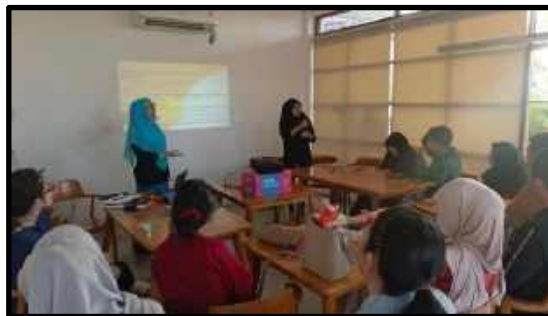
Gambar 1 Penyajian materi tentang Pemahaman Kesehatan Mental

mampu berkomunikasi dengan jelas dan terbuka dapat membangun hubungan yang lebih baik dengan karyawan, meningkatkan kepuasan kerja, dan mendorong kerja tim yang lebih baik (Febriyansyah dkk., 2024) Berikut adalah situasi saat materi kesehatan mental diberikan dengan akses juru bahasa isyarat tepat berada di sebelah pemateri (agar arah mata tetap terjaga ke arah pemateri).