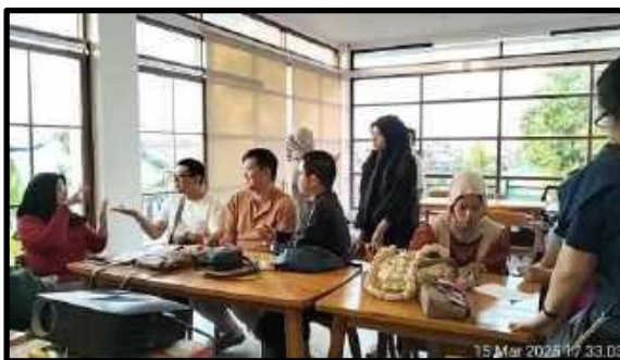
Gambar 3 Proses Tanya Jawab yang dilakukan saat FGD

budaya tuli tanpa campur tangan pihak luar, sebagaimana tampak pada gambar 3 berikut. Diskusi ini berlangsung secara alami dengan dipantau oleh tim PKM untuk mengamati proses berargumen/beropini yang dimunculkan oleh setiap anggota GERKATIN di dalam kelompok.