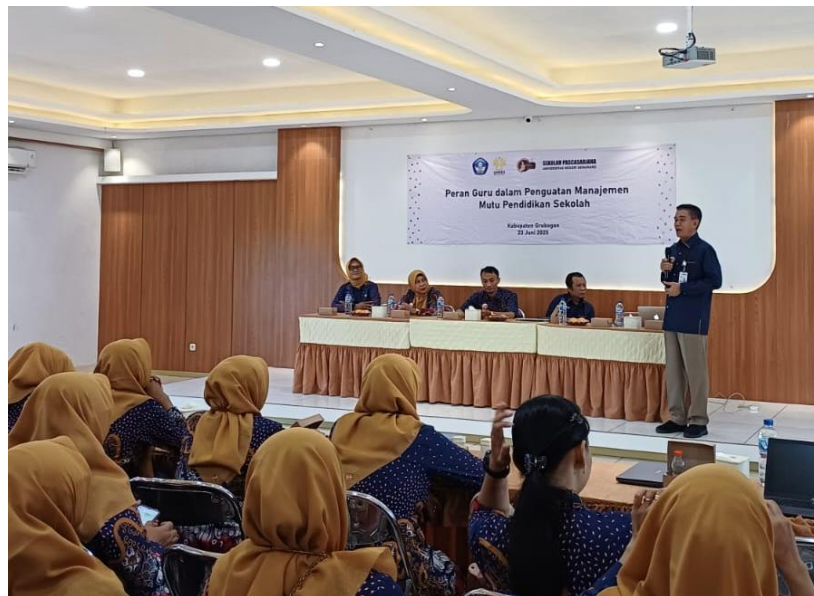
Gambar 2 Sesi Ceramah Penyampaian Konsep Manajemen Mutu Pendidikan

Dalam sesi ceramah interaktif, peserta diberikan pemahaman tentang pentingnya enablers , yaitu faktor-faktor pendukung seperti kepemimpinan kepala sekolah, keterlibatan guru, strategi pendidikan, serta dukungan sarana dan prasarana yang memadai. Peserta turut diajak untuk memahami bahwa penguatan mutu pendidikan tidak dapat terlepas dari kolaborasi dan keterlibatan aktif semua pihak di sekolah, khususnya guru sebagai penggerak utama proses pembelajaran. Pada tahap implementation , peserta didampingi mengevaluasi kesesuaian pelaksanaannya dengan prinsip-prinsip mutu. Kegiatan pendampingan menekankan pada pembelajaran yang fokus pada peningkatan kualitas, peran guru dalam merancang program pembelajaran, kegiatan perencanaan dan evaluasi mutu sekolah (Ford & Forsyth, 2021; LeMahieu et al., 2017).