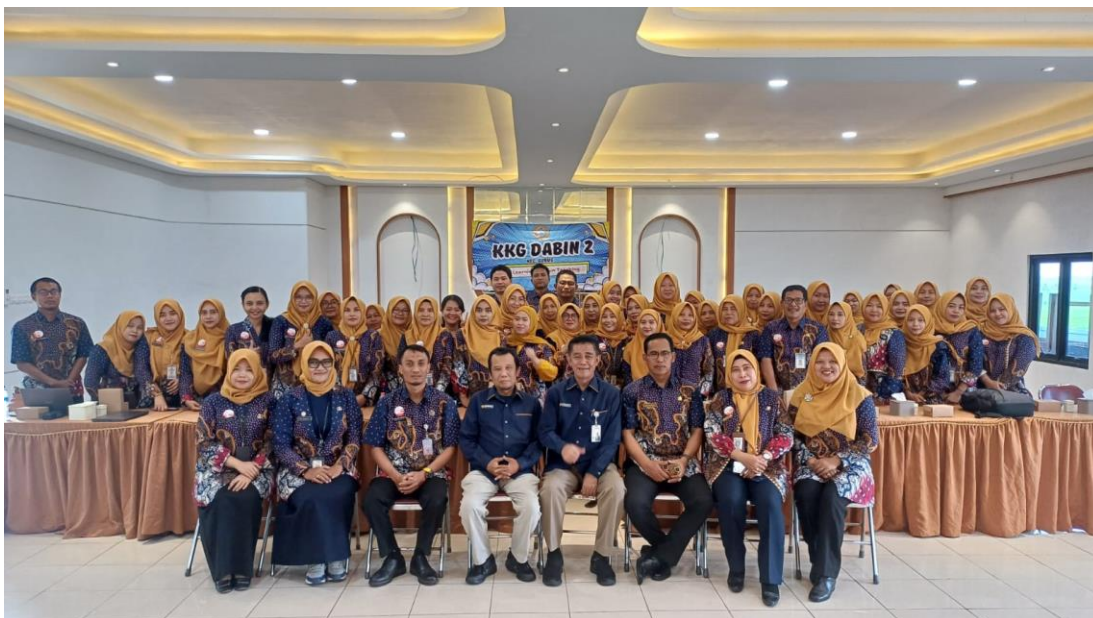
Gambar 3 Peserta Pengabdian Kepada Guru Sekolah Dasar di Kabupaten Grobogan

Tahap terakhir, yaitu act (tindakan perbaikan), menekankan pentingnya tindak lanjut berdasarkan hasil evaluasi. Peserta diajak untuk melakukan penyesuaian, perbaikan, atau inovasi terhadap praktik yang belum optimal. Penerapan siklus PDCA secara konsisten, guru diharapkan mampu menumbuhkan budaya reflektif dan adaptif dalam meningkatkan kualitas pembelajaran dan layanan pendidikan di sekolah (Wiharjo & Wulandari, 2023).