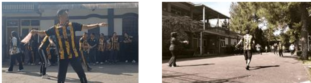
Gambar 3 Kondisi Setelah Kegiatan Pelatihan

terutama menyadarkan guru pendidikan jasmani akan pentingnya keterlibatan aktif siswa selama pembelajaran berlangsung. Setelah melakukan analisis dan evaluasi peserta kembali melakukan praktek kegiatan lempar-tangkap menggunakan permainan tradisional dan terlihat peningkatan keaktifannya, yang dapat dilihat pada gambar 3.