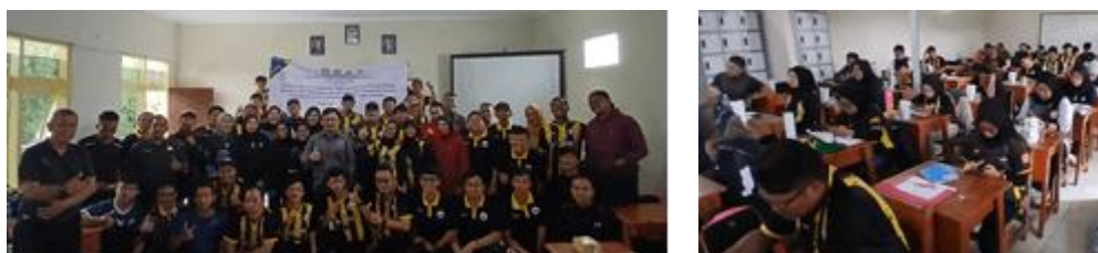
Gambar 2 Pembukaan dan Pelaksanaan Kegiatan Pelatihan

Berdasarkan keadaan tersebut, maka pelaksanaan kegiatan Pengabdian ini menjadi sangat penting. Terutama dalam konsep meningkatkan kemampuan guru pendidikan jsamani dalam menyajikan pembelajaran yang berkualitas bagi muridnya. Sikap antusias dan keseriusan juga tercermin dari setiap peserta, sebagaimana dapat dilihat pada gambar 2.