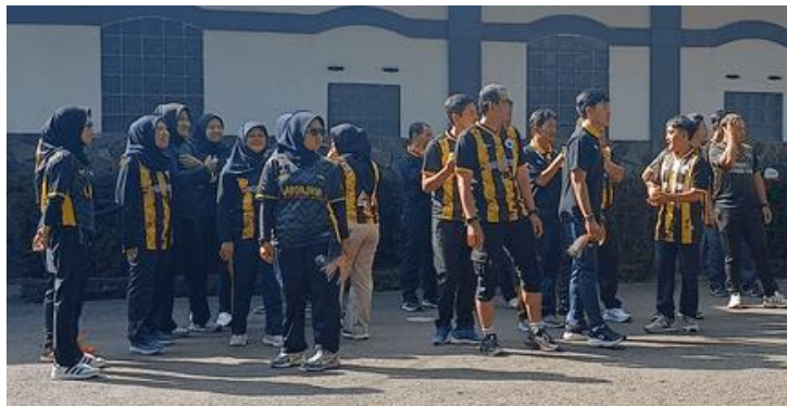
Gambar 1 Kondisi Sebelum Kegiatan Pelatihan

selalu menunggu dan tidak terlibat aktif dalam proses pembelajarannya, sebagai mana terlihat pada Gambar 1.