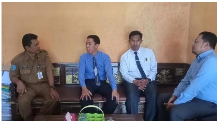
Gambar 2 Sosialisasi dengan Pemerintah Desa Slahung

Isu kesehatan lansia menjadi salah satu perhatian utama dalam upaya meningkatkan kualitas hidup masyarakat pedesaan. Lansia merupakan kelompok usia yang rentan terhadap berbagai penyakit tidak menular akibat penurunan fungsi organ secara alami serta kurangnya akses terhadap layanan kesehatan yang memadai (Syarifah et al., 2025). Rendahnya pengetahuan masyarakat Desa Slahung terkait deteksi dini dan pencegahan penyakit dibuktikan secara kuantitatif melalui pre-test pengetahuan kesehatan yang diberikan kepada 90 lansia peserta kegiatan pemeriksaan kesehatan. Gambar 2 menunjukkan kegiatan sosialisasi yang dilakukan tim pengabdian bersama Pemerintah Desa Slahung sebagai bagian dari tahap awal pelaksanaan program.