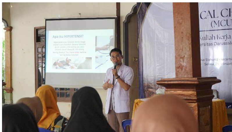
Gambar 4 Penjelasan edukatif dokter RS. Yasfin tentang Kesehatan

Kegiatan ini juga menjadi sarana untuk mendeteksi masalah Kesehatan dan membangun kebiasaan masyarakat untuk lebih peduli terhadap kondisi tubuh mereka, terutama bagi lansia yang cenderung mengalami penurunan fungsi organ secara alami (Sunandar et al., 2025). Pemeriksaan berkala ini diharapkan dapat menjadi program berkelanjutan di Desa Slahung dengan dukungan pihak desa serta kerja sama dengan fasilitas kesehatan terdekat. Gambar 4 menunjukkan kegiatan penyampaian edukasi kesehatan oleh dokter dari RS Yasfin kepada para peserta. Edukasi bertujuan meningkatkan pemahaman lansia tentang pentingnya menjaga kesehatan dan mencegah penyakit.