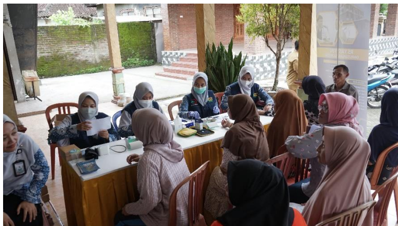
Gambar 3 Kegiatan Medical Check Up lansia

Minimnya pengetahuan masyarakat terhadap gejala awal dan pencegahan penyakit tersebut menjadi salah satu faktor yang menyebabkan kondisi ini kurang tertangani. Keterbatasan akses terhadap fasilitas kesehatan, baik secara ekonomi maupun geografis, membuat sebagian besar lansia tidak pernah atau jarang melakukan pemeriksaan medis secara berkala (Ximenes, 2025). Oleh karena itu, kegiatan ini menjadi penting sebagai bentuk intervensi awal terhadap isu kesehatan lansia di desa tersebut. Gambar 3 memperlihatkan pelaksanaan kegiatan medical check-up pada lansia di Desa Slahung. Kegiatan ini merupakan bagian dari upaya deteksi dini dan pemantauan kondisi kesehatan masyarakat lanjut usia.