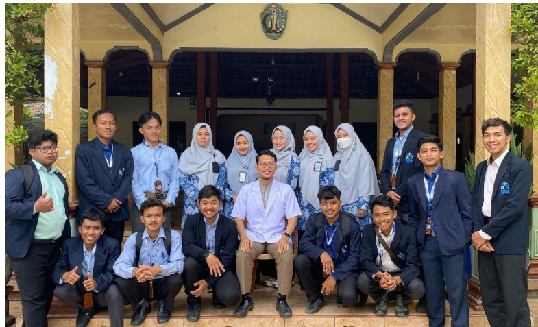
Gambar 5 Peserta pengabdian dengan dokter dan tenaga medis RS. Yasfin

Konsultasi langsung antara peserta dan dokter sangat membantu lansia dalam memahami kondisi kesehatan masing-masing (Lupiana & Mulyani, 2024). Banyak peserta menyampaikan keluhan seperti sakit kepala, nyeri sendi, atau sulit tidur, yang kemudian dijelaskan penyebab dan cara penanganannya secara sederhana oleh dokter. Interaksi ini memberi dampak positif, karena peserta merasa diperhatikan dan mulai menyadari pentingnya menjaga pola hidup sehat sebagai bentuk pencegahan penyakit sejak dini. Gambar 5 memperlihatkan interaksi antara peserta pengabdian dengan dokter dan tenaga medis RS Yasfin sebagai proses konsultasi langsung yang membantu peserta memahami kondisi kesehatannya secara lebih mendalam.