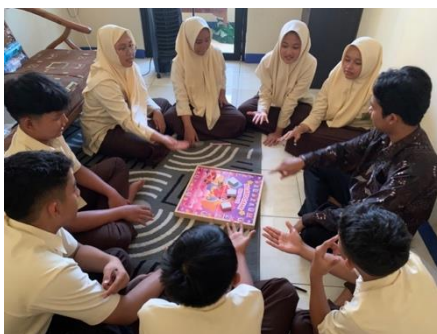
Gambar 5 Tahap Kegiatan

Setelah tahap peralihan selesai dilanjutkan tahap kegiatan. Tahap kegiatan merupakan tahapan inti dimana konselor dan anggota kelompok bersama-sama membahas topik bimbingan kelompok secara tuntas (Andriati et al., 2019). Tahap ini merupakan inti dalam kegiatan layanan bimbingan kelompok dimana topik atau bahasan materi berkaitan dengan pemahaman self love siswa dibahas. Pada kegiatan ini bimbingan kelompok menggunakan media board game self love. Berikut merupakan gambar tahap kegiatan.