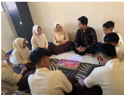
Gambar 3 Tahap Pembentukan

Pada tahap ini konselor menerima anggota kelompok sejumlah 7 peserta didik untuk dipersilahkan duduk secara melingkar. Konselor berhasil menciptakan suasana awal yang hangat dan saling percaya untuk memulai bimbingan kelompok. Konselor mengajak seluruh anggota kelompok untuk berdoa sebagai bentuk rasa syukur. Berikut merupakan gambar pada kegiatan tahap persiapan.