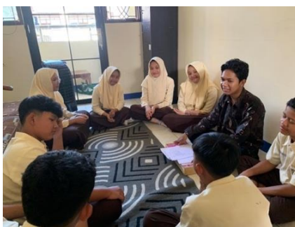
Gambar 6 Tahap Pengakhiran

Kegiatan diakhiri melalui tahap pengakhiran, tahap pengakhiran merupakan tahap akhir dalam layanan bimbingan kelompok meliputi konselor memberitahu kepada anggota kelompok bahwa kegiatan akan segera diakhiri, membahas kesimpulan bimbingan kelompok, penyampaian kesan dan pesan selama kegiatan, serta pengakhiran (Hidayati & Nofari, 2015). Pada tahap ini, konselor menyampaikan kepada seluruh anggota kelompok bahwa kegiatan bimbingan kelompok akan segera berakhir. Konselor mengarahkan kelompok untuk bersama-sama merefleksikan kembali proses yang telah dilalui, dengan mengajak peserta membahas kesimpulan dari kegiatan bimbingan kelompok. Diskusi difokuskan pada pemahaman terhadap materi yang telah dibahas, keterampilan atau sikap yang telah dikembangkan, serta hal-hal penting yang diperoleh selama mengikuti layanan. Beberapa peserta juga diberi kesempatan untuk menyampaikan kesan dan pesan secara sukarela mengenai pengalaman mereka. Berikut merupakan kegiatan pada tahap pengakhiran.