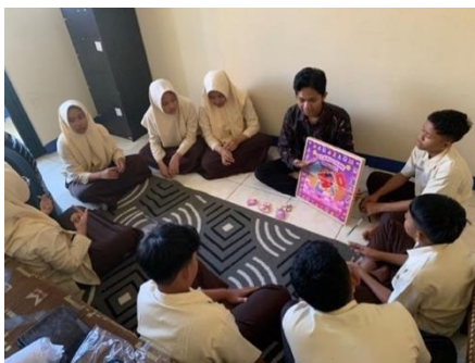
Gambar 4 Tahap Peralihan

Kegiatan selanjutnya yaitu tahap peralihan, tahap peralihan merupakan lanjutan dari pembentukan dimana konselor membangun keakraban melalui ice breaking , menegaskan kembali kegiatan bimbingan kelompok, dan menanyai kesiapan kegiatan (Fitriati, 2017). Konselor mengajak siswa untuk bermain ice breaking kapal sambung cerita, anggota kelompok secara bergantian memilih kapal dimana di dalamnya terdapat 1 kata untuk dijadikan sebuah cerita yang menarik dan memiliki selera humor. Berikut merupakan gambar kegiatan peralihan.