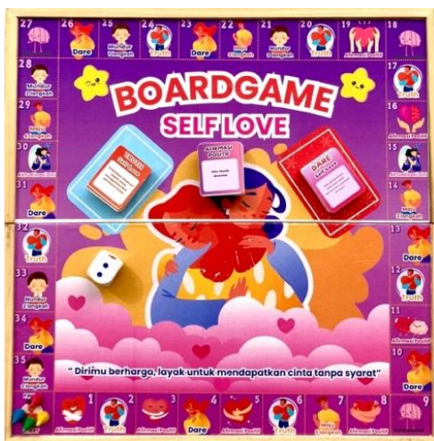
Gambar 2 Media Board game Cinta Diri

Pelaksanaan layanan bimbingan kelompok berbantuan media board game cinta diri dilaksanakan tanggal 6 Agustus 2025 pukul 14.00 WIB-14.40 WIB dengan diikuti 8 siswa. Layanan bimbingan kelompok ini menggunakan media sebagai sarana penyampaian materi yaitu board game cinta diri. Secara keseluruhan tahap persiapan berjalan dengan lancar, dimana pengabdian berkoordinasi dengan guru BK dan menyiapkan media yang digunakan dalam layanan bimbingan kelompok. Tampilan media board game cinta diri dapat dilihat pada gambar 2.