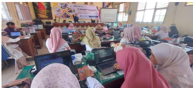
Gambar 3 Pelatihan hari ke-1

memulai kebiasaan baru. Selanjutnya, pelatihan terstruktur 2 Hari (18 JP) dilaksanakan pada tanggal 27 Agustus s.d. 28 Agustus di ruang guru SMA N 1 Lareh Sago Halaban sebagaimana terlihat dalam gambar 3. Kegiatan ini diikuti oleh 61 orang guru