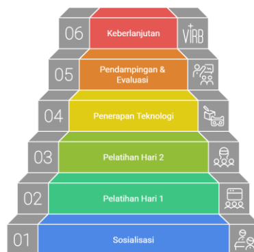
Gambar 1 Alur kegiatan PKM

Alur pelaksanaan PKM secara ringkas diilustrasikan dalam gambar 1.