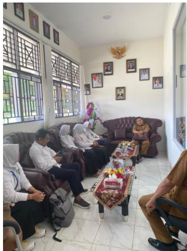
Gambar 2 Sosialisasi dan Koordinasi dengan Mitra

Sosialisasi & Penyiapan Lingkungan Belajar dilaksanakan pada tanggal 27 Juli tim pelaksana PkM berdiskusi dengan Kepala Sekolah, Wakil Bidang Kurikulum, dan 6 orang perwakilan guru SMA N 1 Lareh Sago Halaban tentang teknis keterlibatan guru-guru peserta dalam kegiatan pelatihan (Gambar 2).