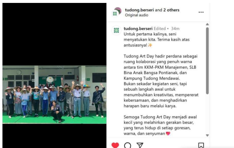
Gambar 4 Dokumentasi dan Publikasi

Adat Rajo Penghulu (Putri dkk., 2025), Dokumentasi kegiatan juga menjadi bukti visual yang dapat digunakan untuk mempromosikan program serupa kepada institusi pendidikan lainnya.