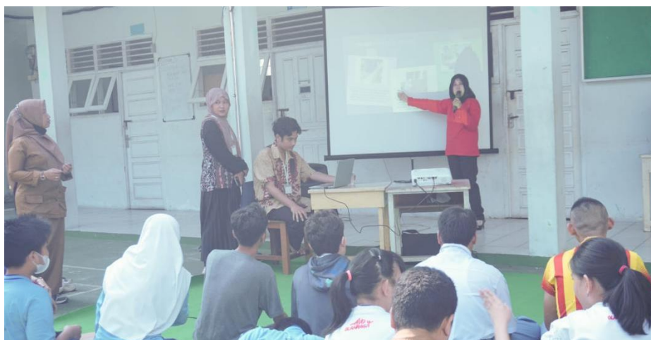
Gambar 2 Penyampaian Materi oleh Ketua Pokdarwis Kampung Tudong

Tingkat partisipasi dan antusiasme peserta menunjukkan hasil yang sangat positif, siswa SLB yang mengikuti berjumlah 15 orang beserta guru pendamping menunjukkan keterlibatan aktif dalam setiap tahapan kegiatan. Antusiasme peserta terlihat dari keingintahuan mereka yang tinggi terhadap proses pembuatan tudong , sejarah kerajinan ini, dan nilai budaya yang terkandung di dalamnya. Respons positif juga ditunjukkan oleh pihak sekolah yang menyambut baik program ini sebagai bentuk edukasi budaya lokal yang jarang di dapatkan oleh pihak sekolah sebelumnya. Sesi edukasi yang disampaikan oleh perajin tudong dengan dukungan guru pendamping sebagai fasilitator komunikasi berhasil menciptakan suasana pembelajaran yang kondusif dan menyenangkan bagi seluruh peserta.