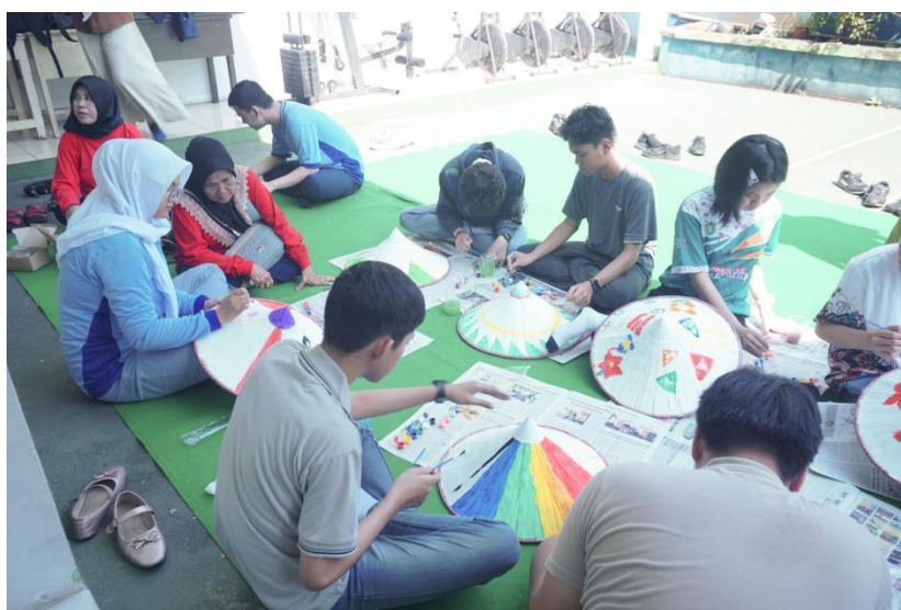
Gambar 3 Kegiatan Melukis Tudong

Pada tahap ini, implikasi terhadap brand awareness yang dihasilkan ialah meningkatkan knowledge awareness terhadap produk kerajinan tudong . Setiap peserta diberikan satu tudong polos yang kemudian di hias sesuai dengan kreativitas masing-masing serta didampingi oleh para perajin Kampung Tudong. Proses ini tidak hanya memberikan pengalaman seni yang menyenangkan, tetapi juga membantu peserta memahami fungsi dan keindahan tudong sebagai produk kerajinan tradisional.