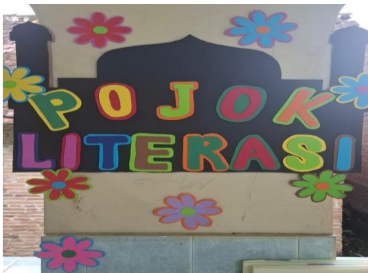
Gambar 1 Pojok Literasi

Evaluasi dilakukan setiap minggu melalui pengukuran frekuensi kunjungan, partisipasi anak, serta kemampuan menceritakan kembali isi bacaan. Evaluasi ini juga dilakukan menggunakan tes sederhana untuk mengukur pemahaman cerita. Berdasarkan monitoring selama pelaksanaan kegiatan, ditemukan adanya peningkatan minat baca yang ditunjukkan dari semakin banyaknya kunjungan anak ke pojok literasi dan meningkatnya kemampuan anak merangkum isi buku. Hal ini menegaskan bahwa penyediaan fasilitas yang menarik serta pendampingan intensif mampu meningkatkan minat baca secara signifikan.