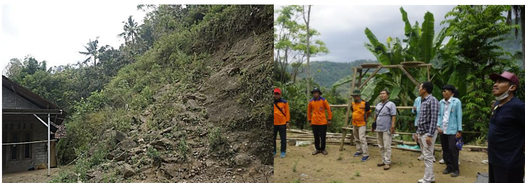
Gambar 3 Survei Lapangan Untuk Menentukan Titik Potensial Pemasangan EWS Longsor

Survei ini juga berfungsi sebagai sarana transfer pengetahuan kepada anggota FPRB mengenai cara identifikasi tanda-tanda awal longsor, seperti retakan tanah, perubahan arah aliran air permukaan, dan pergeseran vegetasi. Dengan demikian, kegiatan ini tidak hanya bersifat teknis, tetapi juga edukatif bagi masyarakat sekitar. Melalui pendekatan ini, masyarakat tidak hanya menjadi penerima informasi, tetapi juga aktor aktif dalam proses pemantauan risiko di lingkungan mereka sendiri. Peningkatan kapasitas ini diharapkan mampu memperkuat ketangguhan komunitas dalam mendeteksi potensi bencana secara mandiri sebelum terjadi kondisi yang lebih kritis.