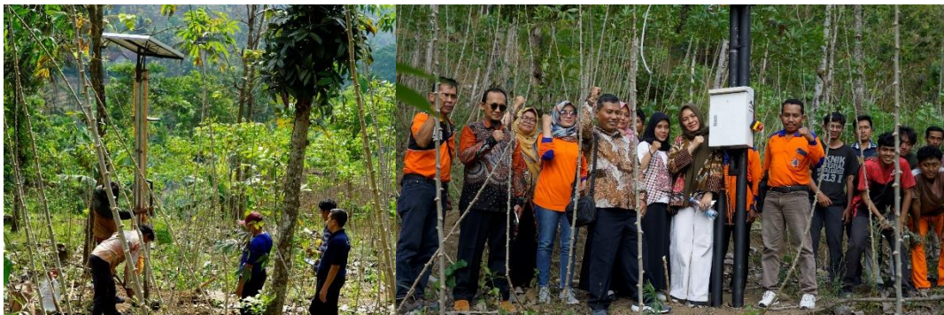
Gambar 4 Pemasangan EWS dilakukan Dusun Jladri RW 1 RT 02 Desa Pucung

peringatan dini kepada warga, sehingga mampu meminimalkan risiko korban jiwa dan kerugian material apabila terjadi longsor.