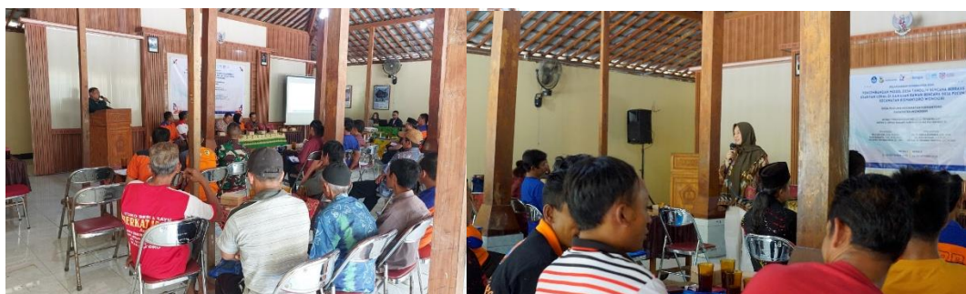
Gambar 5 Pelatihan Tanggap Darurat Bencana Dan Pelatihan Sistem Peringatan Dini Komunitas

Tahapan utama kegiatan meliputi pelatihan tanggap darurat bencana, serta pelatihan sistem peringatan dini berbasis komunitas yang disampaikan oleh Pendamping bisa lihat pada gambar 5. Pelatihan ini dirancang untuk meningkatkan pengetahuan dan keterampilan masyarakat dalam menghadapi potensi bencana tanah longsor melalui pendekatan partisipatif. Untuk mengukur efektivitas kegiatan, peserta mengikuti pre-test dan post-test yang digunakan sebagai instrumen evaluasi peningkatan pemahaman terhadap materi kesiapsiagaan bencana.