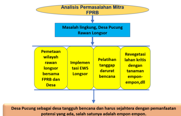
Gambar 1 Tahapan Pelaksanaan kegiatan kosabangsa di mitra FPRB

Tahapan pelaksanaan program meliputi persiapan, edukasi dan implementasi, serta monitoring dan evaluasi, sebagaimana dalam model manajemen risiko bencana berbasis komunitas (Danan et al., 2022). Tahap persiapan meliputi koordinasi dan pemetaan lokasi rawan bencana bersama Forum Pengurangan Risiko Bencana (FPRB) dan Desa Pucung. Dilanjutkan dengan edukasi berbasis kearifan lokal terkait manfaat empon-empon dalam mitigasi bencana dan peningkatan ekonomi. Implementasi alat EWS longsor, penanaman lahan kritis untuk ditanami empon-empon, menjadi tahapan lanjut untuk merealisasikan program. Terakhir, dilakukan monitoring dan evaluasi berkala terhadap keberhasilan dan keberlanjutan program. Secara detail tahapan pelaksanaan kegiatan kosabangsa dalam rangka merealisasikan solusi yang ditawarkan disajikan dalam gambar 1.