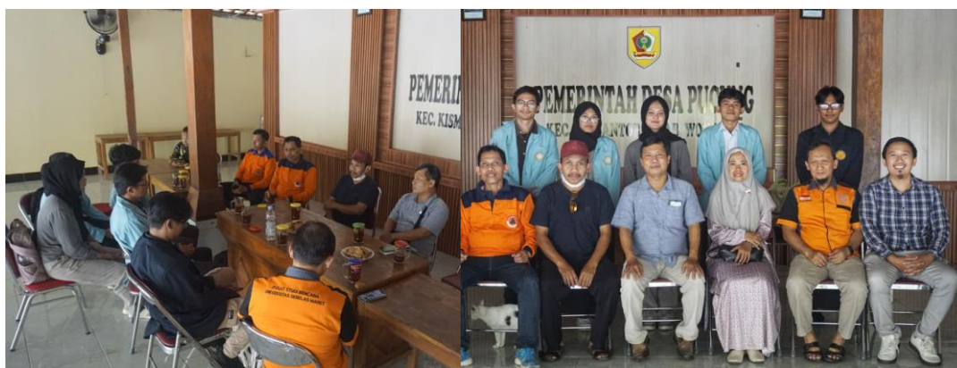
Gambar 2 Koordinasi dengan FPRB

Kegiatan koordinasi menjadi langkah penting untuk memastikan seluruh pihak memahami peran masing-masing dan komitmen bersama dalam menjaga keberlanjutan sistem peringatan dini yang akan dikembangkan (Haris et al., 2023). Diskusi juga mencakup aspek teknis, seperti titik rawan longsor di Dusun Jladri RW 1 RT 02 dan RW 1 RT 05, serta kesiapan infrastruktur pendukung. Selain itu, koordinasi ini berfungsi sebagai forum untuk menyelaraskan kebutuhan masyarakat dengan rancangan teknis program sehingga intervensi yang dilakukan benar-benar kontekstual. Para pemangku kepentingan juga menilai potensi hambatan lapangan, termasuk aksesibilitas lokasi dan dukungan logistik, untuk meminimalkan risiko kegagalan implementasi. Tahap ini sekaligus memperkuat hubungan kerja antara tim akademisi dan FPRB, yang menjadi fondasi penting bagi keberlanjutan program di tingkat desa.