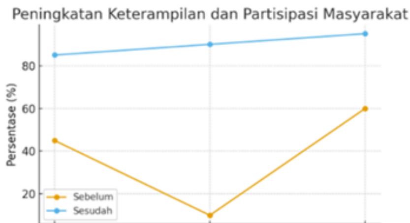
Gambar 6 Peningkatan Keterampilan dan Partisipasi Masyarakat (grafik garis: sumbu X = aspek kegiatan, sumbu Y = persentase; menunjukkan kenaikan dari 45–60% menjadi 85–95%)