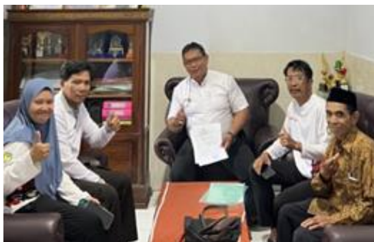
Gambar 1 Penandatanganan kesepakatan pelaksanaan kegiatan PTTI dengan Mitra sasaran didampingi kepala Desa Borisallo

Tahapan kegiatan dimulai dengan pelatihan teknis pembuatan panel bulu ayam, dilanjutkan dengan perakitan sistem pompa air bertenaga surya, serta pendampingan penggunaan dan perawatan sistem. Mitra dilibatkan secara langsung dalam setiap proses, mulai dari pengumpulan bahan limbah bulu ayam, pembuatan panel, hingga instalasi sistem energi surya. Hasil kegiatan menunjukkan peningkatan signifikan dalam aspek keterampilan teknis, literasi energi terbarukan, dan produktivitas pertanian.