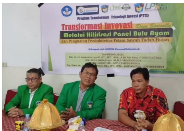
Gambar 3 Seminar pelaksanaan kegiatan PTTI didampingi kepala Desa Borisallo

Gambar 2 menggambarkan komitmen bersama antara tim pelaksana dan mitra sasaran dalam pelaksanaan kegiatan PTTI yang dilakukan dengan pendampingan Kepala Desa Borisallo. Momen ini mencerminkan kesepahaman dan kesiapan seluruh pihak untuk menjalankan program secara kolaboratif, sekaligus menegaskan dukungan pemerintah desa dalam mendorong keberhasilan dan keberlanjutan kegiatan.