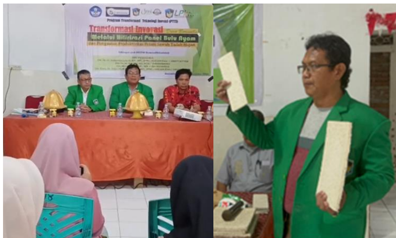
Gambar 4 Pelatihan dan Pendampingan Transformasi Inovasi Panel Bulu Ayam

Gambar 4 menunjukkan kegiatan pelatihan dan pendampingan dalam proses transformasi inovasi panel bulu ayam yang melibatkan tim pelaksana dan mitra sasaran. Kegiatan ini berfokus pada transfer pengetahuan dan keterampilan teknis, mulai dari pengolahan bahan hingga proses pembuatan panel. Pendampingan dilakukan secara langsung untuk memastikan peserta mampu memahami dan menerapkan teknologi secara mandiri, sehingga mendukung peningkatan kapasitas dan keberlanjutan inovasi di tingkat masyarakat.