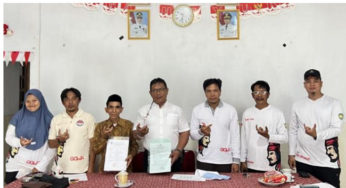
Gambar 2 Komitmen pelaksanaan kegiatan PTTI dengan Mitra sasaran didampingi kepala Desa Borisallo

Gambar 2 menggambarkan komitmen bersama antara tim pelaksana dan mitra sasaran dalam pelaksanaan kegiatan PTTI yang dilakukan dengan pendampingan Kepala Desa Borisallo. Momen ini mencerminkan kesepahaman dan kesiapan seluruh pihak untuk menjalankan program secara kolaboratif, sekaligus menegaskan dukungan pemerintah desa dalam mendorong keberhasilan dan keberlanjutan kegiatan.