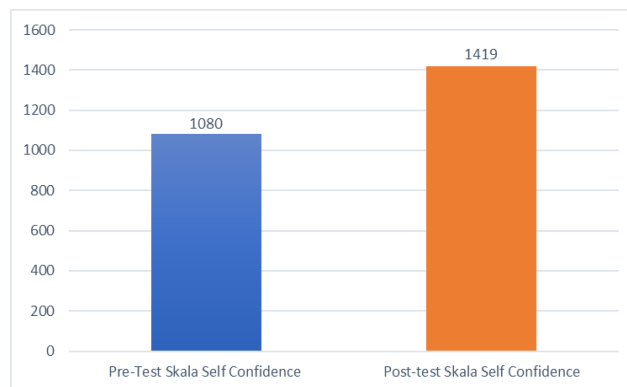
Gambar 6 Diagram Batang Perbandingan Hasil Pre & Post-test

Berdasarkan gambar 6, terlihat adanya peningkatan skor self-confidence peserta setelah mengikuti kegiatan psikoedukasi. Mayoritas peserta menunjukkan kenaikan nilai pada post-test yang menunjukkan adanya perubahan positif dalam keyakinan diri serta kemampuan mereka untuk mengekspresikan potensi diri di depan orang lain. Kondisi ini selaras dengan tujuan kegiatan, yaitu membantu siswa untuk memahami sekaligus mempraktikkan personal branding positif secara nyata dalam kehidupan sehari-hari. Pola peningkatan yang sejenis juga terlihat pada hasil pengukuran self-confidence , sebagaimana ditunjukkan melalui hasil uji Wilcoxon pada tabel berikut ini.