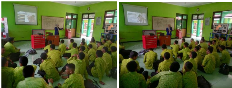
Gambar 2 Sesi Penyampaian Materi

Tahap selanjutnya adalah pelaksanaan kegiatan sesuai jadwal yang telah direncanakan, meliputi pembukaan, penyampaian materi inti, dan sesi interaksi bersama peserta. Tahap ini menjadi inti program karena peserta memperoleh pemahaman dan pengalaman langsung terkait materi. Program pengabdian masyarakat bertema Optimalisasi Personal Branding Positif untuk Meningkatkan Self-Confidence pada Siswa dilaksanakan pada Kamis, 18 September 2025 di SMK Negeri 1 Mejayan, Kabupaten Madiun, Jawa Timur, dengan sasaran siswa kelas XI TO 2 sebanyak 30 peserta (28 laki-laki dan 2 perempuan). Sebelum penyampaian materi, tim pengabdian memberikan pre-test untuk mengukur tingkat pemahaman awal peserta. Untuk memberikan gambaran terkait jalannya kegiatan pengabdian masyarakat, berikut disajikan dokumentasi pada setiap tahapan pelaksanaan yang telah dilakukan. Kegiatan inti diawali dengan sesi pemaparan materi kepada peserta, yang bertujuan untuk memberikan pemahaman awal mengenai pentingnya personal branding .