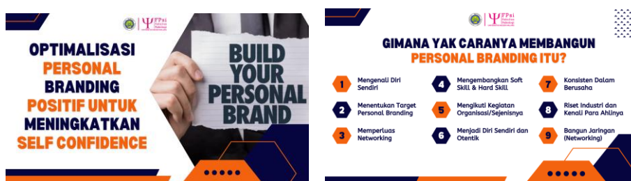
Gambar 1 Slideshow Materi Pengabdian Masyarakat

Pada materi self-confidence dikembangkan berdasarkan teori (Pohan, 2023) yang menjelaskan dimensi, faktor, dan strategi peningkatannya, sedangkan personal branding merujuk pada (Apriliyanti et al., 2024) yang menekankan pentingnya citra diri positif untuk meningkatkan kepercayaan diri dan potensi individu. Pemilihan kedua teori ini bertujuan agar materi bersifat konseptual sekaligus aplikatif. Untuk memberikan gambaran mengenai materi yang disampaikan dalam kegiatan pengabdian masyarakat, berikut ditampilkan slideshow materi yang digunakan selama pelaksanaan kegiatan.