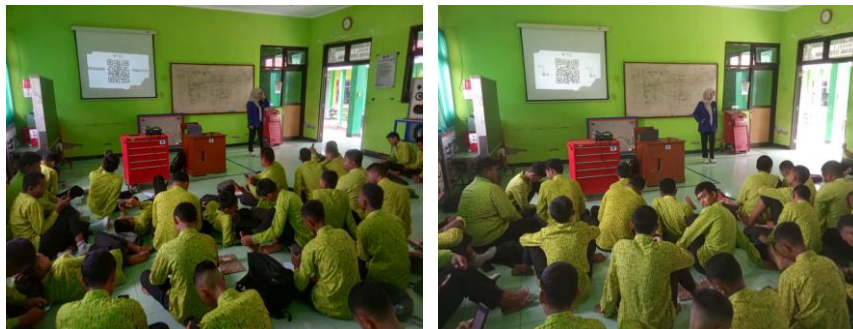
Gambar 4 Mengerjakan Pre-test , Post-test & Evaluasi

diberikan, sekaligus menilai efektivitas kegiatan yang dilaksanakan. Berikut disajikan dokumentasi kegiatannya.