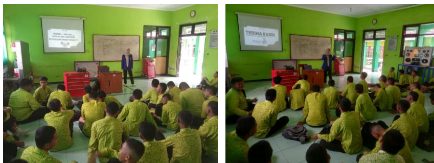
Gambar 3 Sesi Tanya Jawab

Selanjutnya, dilakukan tahap evaluasi melalui pelaksanaan pre-test dan post-test untuk mengukur tingkat pemahaman peserta terhadap materi yang telah