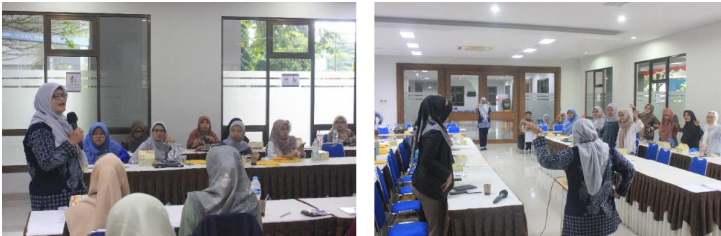
Gambar 2 Penyampaian Materi dan Praktik Pada Sesi Workshop

2025), selain itu, strategi pembelajaran yang kontekstual dan komunikatif juga berperan penting dalam mengembangkan keterampilan produktif seperti speaking dan writing melalui praktik langsung di kelas (Astuti & Kalayo Hasibuan, 2025). Sesi ini memberikan dasar yang kuat bagi peserta untuk mengikuti sesi Kerja Mandiri serta sesi umpan balik. Dokumentasi kegiatan penyampaian materi dan praktik pada sesi workshop ditampilkan pada gambar 2.