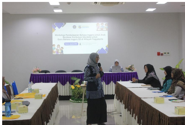
Gambar 1 Penyampaian Materi Pada Sesi Pra-Workshop

sebelumnya. Rubrik yang disusun berdasarkan indikator kognitif dan keterampilannya seperti Taksonomi Bloom terbukti efektif dalam meningkatkan kualitas penilaian dan keselarasan dengan tujuan pembelajaran (Sukenti & Anggraini, 2025). Dalam konteks pembelajaran bahasa Inggris sebagai bahasa Asing, keselarasan antara tujuan pembelajaran dan penilaian juga menghasilkan dampak positif terhadap proses belajar siswa ( positive washback ) (Phuong et al., 2025). Setelah sesi penyampaian materi dalam sesi pra-workshop selesai, sesi diakhiri oleh tanya jawab antara pemateri dan peserta. Dokumentasi kegiatan sesi pra-workshop ditampilkan pada gambar 1.