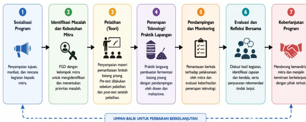
Gambar 1 Bagan Alur Program Pelaksanaan Kegiatan

lembar observasi praktik dengan indikator kemampuan menyiapkan bahan sesuai formulasi, ketepatan pencacahan dan pencampuran, teknik pengemasan dan pemadatan dalam silo, serta prosedur penyimpanan dan pembukaan silase, dimana setiap indikator dinilai menggunakan skala skor 1–4 dan dirata-ratakan; (3) kualitas fisik silase yang dihasilkan yang diukur melalui pengamatan langsung dengan indikator warna (mendekati bahan awal), aroma (asam segar/tidak busuk), dan tekstur (lembut/tidak berlendir), yang dinilai menggunakan skala kualitatif atau skor numerik; serta (4) tingkat partisipasi aktif anggota kelompok yang diukur melalui lembar kehadiran dan observasi dengan indikator persentase kehadiran, keaktifan dalam diskusi, keterlibatan dalam praktik lapangan, dan kontribusi dalam kegiatan, yang dinilai berdasarkan persentase dan skor partisipasi. Indikator-indikator tersebut digunakan untuk menilai efektivitas pendekatan Participatory Rural Appraisal (PRA) dalam mendorong adopsi teknologi pakan alternatif berbasis sumber daya lokal.