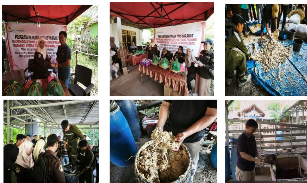
Gambar 2 Proses pembuatan, serah terima produk silase dan uji coba pakan silase ke ternak kambing

Pelaksanaan kegiatan PKM melalui penerapan teknologi fermentasi batang pisang menghasilkan peningkatan pengetahuan dan keterampilan peternak serta produk silase. Peternak memahami proses fermentasi dan mampu mempraktikkan pembuatan silase secara mandiri, mulai dari formulasi bahan hingga penyimpanan. Silase yang dihasilkan memiliki kualitas fisik yang baik, ditandai dengan warna mendekati aslinya, tekstur lembut, dan aroma harum (Permatasari et al., 2025). Kegiatan ini ditunjukkan pada Gambar 2.