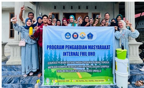
Gambar 6. Foto Bersama Tim Pengabdian FHIL UHO dan anggota Dasawisma Tulip

Secara keseluruhan, kegiatan ini menunjukkan adanya peningkatan signifikan pada aspek kognitif dan keterampilan peserta. Sebelum kegiatan, pemahaman peserta masih terbatas, namun setelah pelatihan peserta mampu menjelaskan konsep, menunjukkan kepedulian lingkungan, serta memiliki keterampilan dasar dalam pengomposan. Pendekatan edukatif-partisipatif berbasis praktik langsung terbukti efektif dalam meningkatkan kapasitas masyarakat (Pratiwi et al., 2024; Hikmat et al., 2025; Hastomo et al., 2024).