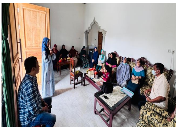
Gambar 1 Kegiatan Sosialisasi Kepada Anggota Dasawisma Tulip Perdos Unhalu

Tahap selanjutnya adalah penyampaian materi melalui metode komunikasi dua arah yang menekankan keterlibatan aktif peserta serta pengaitan materi dengan konteks kehidupan sehari-hari. Pendekatan dialogis ini memungkinkan terjadinya pertukaran pengalaman dan mempercepat proses internalisasi konsep (Hafnizon et al., 2026), sehingga peserta tidak hanya memahami secara teoritis, tetapi juga mampu mengaitkan pengetahuan dengan permasalahan nyata yang dihadapi dalam kehidupan sehari-hari, sebagaimana ditunjukkan pada Gambar 1.