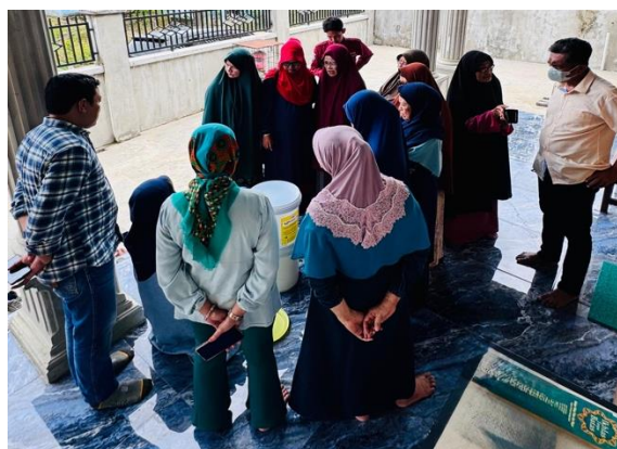
Gambar 3 Praktik Pembuatan Kompos Menggunakan Komposter Sederhana

Tahap praktik pembuatan kompos menjadi komponen kunci dalam mentransformasikan pengetahuan menjadi keterampilan. Melalui praktik langsung yang disertai pendampingan, peserta memperoleh pengalaman empiris yang tidak hanya memperkuat pemahaman prosedural, tetapi juga meningkatkan kepercayaan diri dalam mengelola sampah secara mandiri (Gambar 3). Proses ini sejalan dengan konsep pembelajaran berbasis pengalaman ( experiential learning ) yang menekankan pentingnya learning by doing dalam meningkatkan efektivitas pembelajaran (Yudha, 2025).