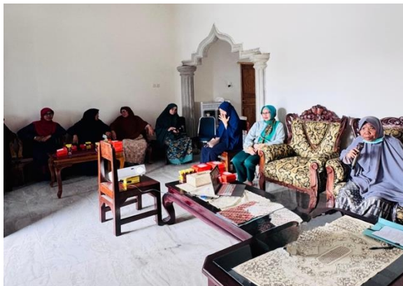
Gambar 2 Partisipasi Aktif Peserta dalam Sesi Tanya Jawab

terjadinya transformasi pengetahuan menjadi orientasi tindakan, yang merupakan indikator kunci dalam keberhasilan program pemberdayaan masyarakat, sebagaimana ditunjukkan pada Gambar 2.