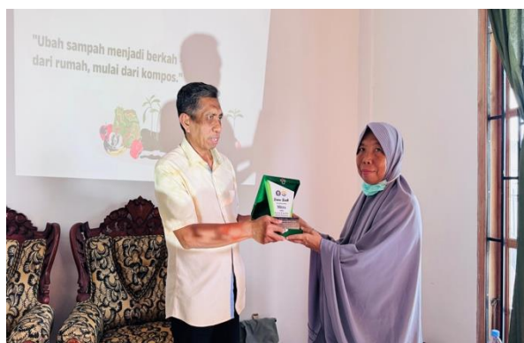
Gambar 5 Penyerahan Plakat kepada Ketua Dasawisma Tulip

Sebagai bentuk penguatan kemitraan, kegiatan ditutup dengan penyerahan plakat kepada Ketua Dasawisma Tulip serta dokumentasi bersama seluruh peserta dan tim pengabdian, sebagaimana ditunjukkan pada Gambar 5 dan Gambar 6.