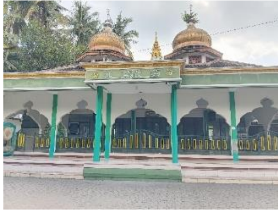
Gambar 3. Masjid Al-Ittihad Padukuhan Gerjen

Kutipan wawancara dengan Bapak R (Tokoh Agama):