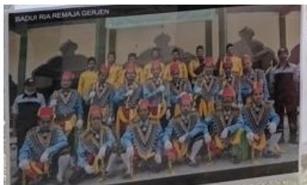
Gambar 5. Kesenian kuntulan remaja Gerjen (Sumber : Dokumentasi Lapangan Peneliti, 25 April 2026)

Selain melalui tradisi dan keluarga, proses pewarisan nilai juga terlihat dalam perkembangan kesenian masyarakat. Karena adanya larangan penggunaan gong, masyarakat kemudian lebih mengembangkan kesenian bernuansa religius seperti hadroh, kuntulan, dan badui. Kesenian tersebut dipandang lebih sesuai dengan nilai keagamaan dan budaya masyarakat setempat.