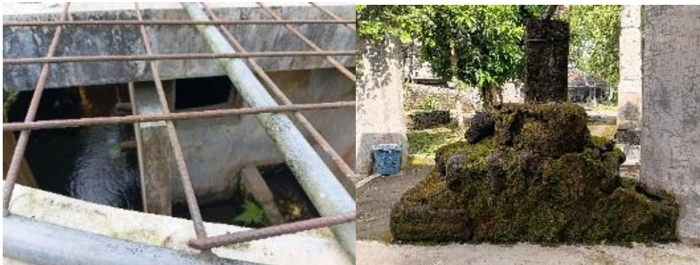
Gambar 4. Sendang Tirtoguno

Selain dipengaruhi oleh nilai religius, larangan menggantung gong juga berkaitan dengan cerita turun-temurun mengenai Sendang Tirtoguno tidak hanya berfungsi sebagai sumber air untuk kebutuhan sehari-hari, tetapi juga dianggap sebagai tempat yang sakral dan punya makna spiritual (Baihaqi & Birsyada, 2022). Dalam masyarakat Jawa, tempat-tempat yang dianggap sakral umumnya dipandang memiliki nilai simbolik dan spiritual yang harus dihormati sebagai bagian dari warisan budaya masyarakat (Rr. M.I. Retno Susilorini, 2023) Berdasarkan cerita yang berkembang di masyarakat, pada masa dahulu terdapat sumber mata air yang terus mengalir sehingga dikhawatirkan menyebabkan wilayah sekitar tergenang air. Untuk menutup sumber mata air tersebut digunakan benda yang menyerupai gong. Karena itu, masyarakat kemudian memandang gong sebagai simbol penting yang harus dihormati dan tidak boleh diperlakukan sembarangan, termasuk digantung.