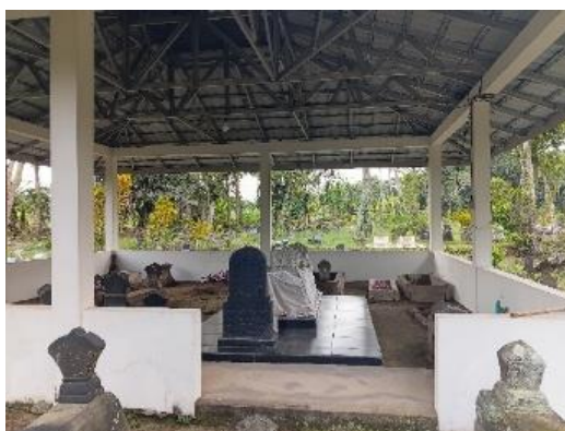
Gambar 2. Makam Tumenggung Nitiprojo

Selain dikenal sebagai masyarakat yang religius, Padukuhan Gerjen juga memiliki keterkaitan dengan perkembangan Islam tradisional dan sejarah perjuangan lokal. Tokoh-tokoh seperti Kiai Thabrani dan Kiai Sutoradi dikenal sebagai penyebar ajaran Islam di wilayah tersebut. Masyarakat juga mengenal sosok Tumenggung Nitiprojo yang dikaitkan dengan sejarah perjuangan pada masa kolonial. Keberadaan tokoh-tokoh tersebut menjadi bagian dari ingatan kolektif masyarakat dan memperkuat identitas budaya masyarakat Padukuhan Gerjen.