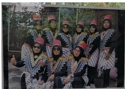
Gambar 7. Kesenian Kuntulan ibu-ibu Gerjen

Kesenian tradisional merupakan salah satu warisan budaya yang memiliki nilai penting dalam kehidupan masyarakat. Selain berfungsi sebagai hiburan, kesenian juga menjadi sarana untuk mempererat hubungan sosial dan melestarikan nilai budaya yang diwariskan secara turun-temurun. Salah satu kesenian yang masih dipertahankan oleh masyarakat adalah kesenian Kuntulan. Keberadaan kesenian ini tidak lepas dari peran aktif para ibu yang terus menjaga dan melestarikannya melalui latihan rutin maupun penampilan dalam berbagai kegiatan masyarakat.