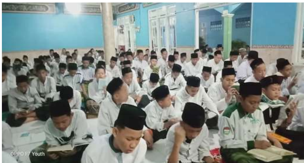
Gambar 3. Kegiatan Santri di Pesantren

rutinitas pesantren, bukan hanya sebagai formalitas kegiatan. Dengan adanya dokumentasi ini, validitas data lapangan menjadi lebih terjamin.