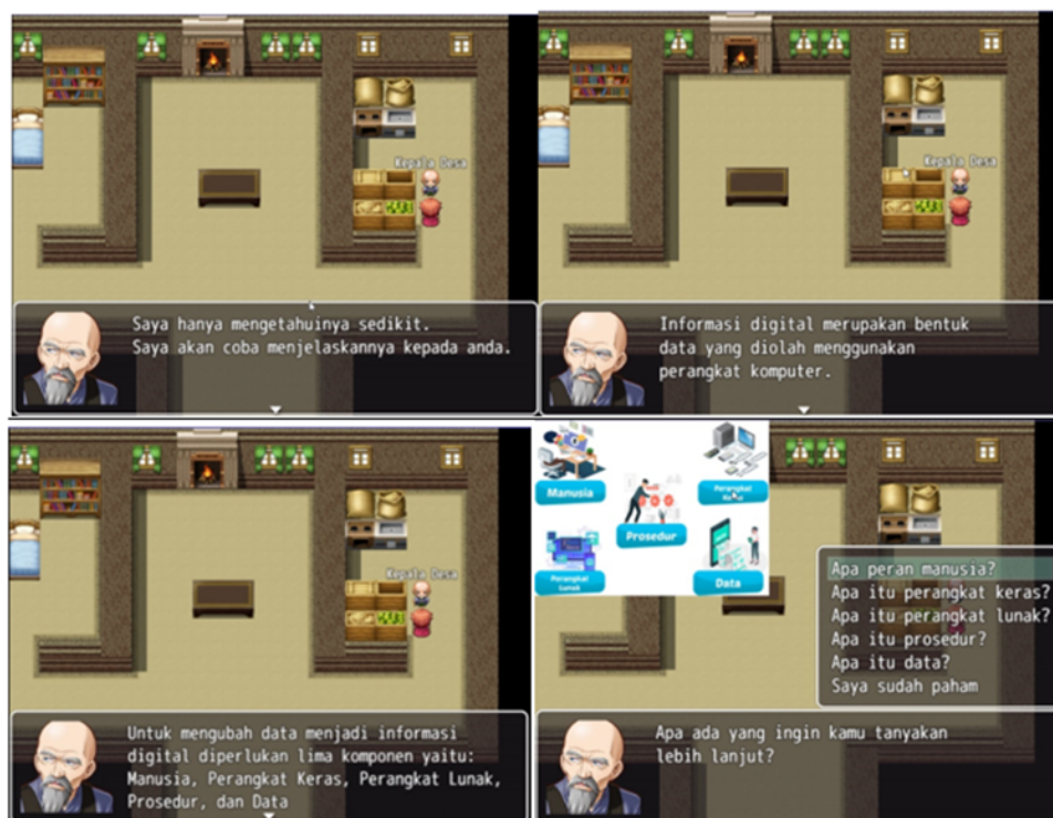
Gambar 2. Game Edukasi Literasi TIK untuk Siswa SMP

dilakukan post-tes untuk mengetahui kemampuan akhir literasi TIK siswa SMP di Kota Pontianak. Adapun contoh tampilan media pembelajaran game edukasi literasi TIK dapat dilihat pada gambar 2.