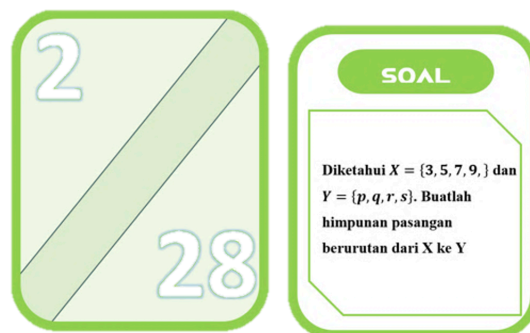
Gambar 1. Desain Kartu

Tahap perancangan berfokus pada perancangan draft awal media Ice Breaking berbasis 4C untuk pembelajaran Relasi dan Fungsi, yang kemudian divalidasi oleh ahli. Format media dirancang agar interaktif dan menyenangkan dengan memodifikasi permainan Jenga, sehingga peserta didik tidak hanya belajar teori tetapi juga mengalami pembelajaran secara langsung. Rancangan awal meliputi desain permainan Jenga dan kartu soal. Jenga terdiri dari 40 balok kayu ringan berukuran 4,5 \times 1,5 \times 0,7 cm, masing-masing diberi angka 1–40 sebagai identitas yang terkait dengan kartu soal. Kartu soal disusun sesuai angka pada balok, dengan dua sisi: bagian depan berisi nomor soal yang dikelompokkan (misalnya, 1 dan 3, 2 dan 4), sedangkan bagian belakang berisi soal yang harus dijawab oleh peserta didik. Ilustrasi desain kartu disajikan pada Gambar 1 dan balok jenga pada Gambar 2.