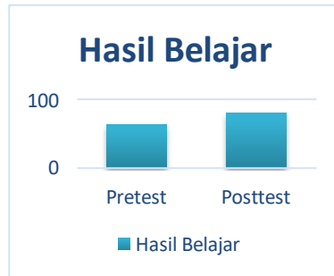
Gambar 2. Hasil Rata-Rata Nilai Pretest dan Posttest

Langkah perhitungan yang pertama adalah dengan melihat hasil pretest dan posttest khas siswa yang menggunakan media mobile learning berbasis android untuk mengetahui sejauh mana keefektifan media pembelajaran tersebut. Hasil perhitungan rata-rata dapat dilihat pada tabel dibawah ini: