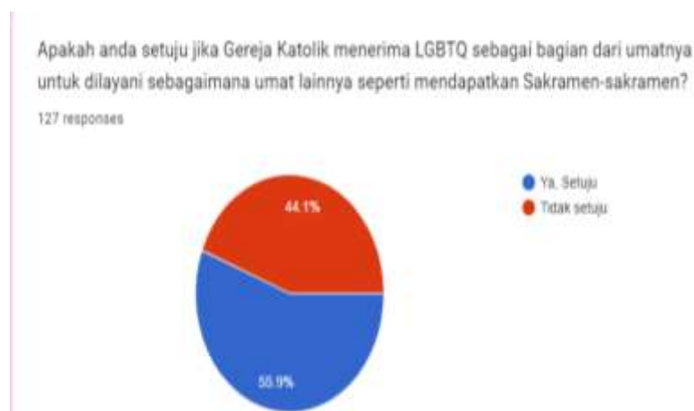
Gambar 7. Tanggapan mahasiswa terhadap LGBTQ dengan mendialogkan dengan ajaran Gereja

Tanggapan mahasiswa kemudian dikerucutkan dengan mengaitkan isu ini pandangan gereja dengan menanyakan tentang pelayanan gereja kepada kelompok LGBTQ. Seperti yang tervisualisasikan dalam gambar 7. sebanyak 55,9% menyatakan setuju jika Gereja menerima anggota LGBTQ sebagai bagian dari umatnya untuk dilayani. Dan 44,1% menyatakan tidak setuju.