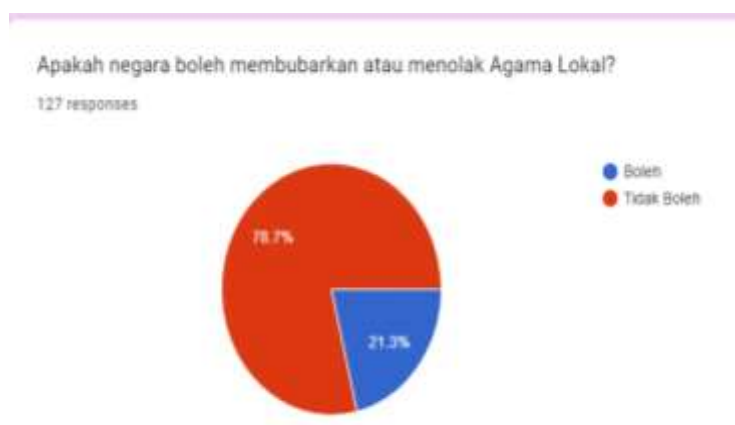
Gambar 5. Pandangan Mahasiswa terhadap Agama Lokal

sekelompok orang atau warga setempat, di mana agama itu tidak diakui oleh negara lain.” Selain dikaitkan dengan negara, agama lokal juga dipahami dalam kaitan dengan agama yang sekarang ada khususnya agama dunia. PR (perempuan, 20 tahun) menjelaskan, “agama lokal adalah agama yang dipercaya oleh orang kampung biasanya yang sudah ada sejak dahulu kala di kala mereka belum mengenal yang namanya agama yang sekarang ini dan beberapa agama lokal masih ada sampai sekarang dan masih dilestarikan oleh turun temurunnya.”