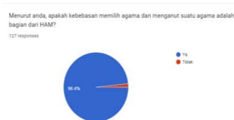
Gambar 3. Pandangan mahasiswa terhadap hak beragama

Diagram di atas menunjukkan bahwa kebanyakan mahasiswa (98,4%) sudah memahami bahwa Kebebasan beragama dan berkeyakinan adalah bagian dari HAM dan 1,6% menyatakan bukan bagian dari HAM.