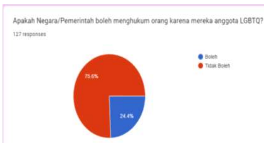
Gambar 6. Tanggapan mahasiswa atas kasus HAM terkait LGBTQ

Berkaitan dengan peran negara terhadap kelompok LGTBQ, kepada para mahasiswa ditanya apakah negara/pemerintah boleh menghukum orang karena mereka anggota LGBTQ? Jawaban mereka tervisualisasikan dalam bagan 1.6. 75,6% mahasiswa menjawab tidak boleh dan 24,4% menjawab boleh. Tanggapan ini menunjukkan data yang berkaitan dengan pemahaman mereka. Kebanyakan mahasiswa yang mengatakan bahwa LGTBQ adalah penyimpangan (seksual, sosial, kodrat dan afeksi) juga mengatakan bahwa negara boleh menghukum warga karena mereka anggota LGBTQ.