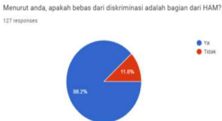
Gambar 2. Pandangan mahasiswa terhadap hak bebas dari diskriminasi

Diagram di atas menunjukkan bahwa kebanyakan mahasiswa (94,5%) sudah memahami bahwa kebebasan berekspresi adalah bagian dari HAM dan 5,5% menyatakan bukan bagian dari HAM.